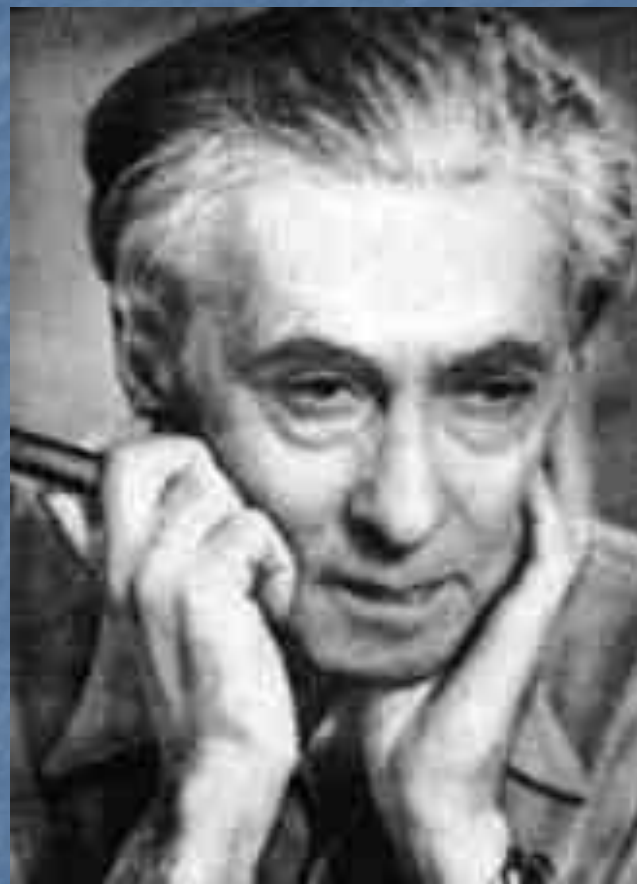
Илья Эренбург (1891-1967) писатель, публицист