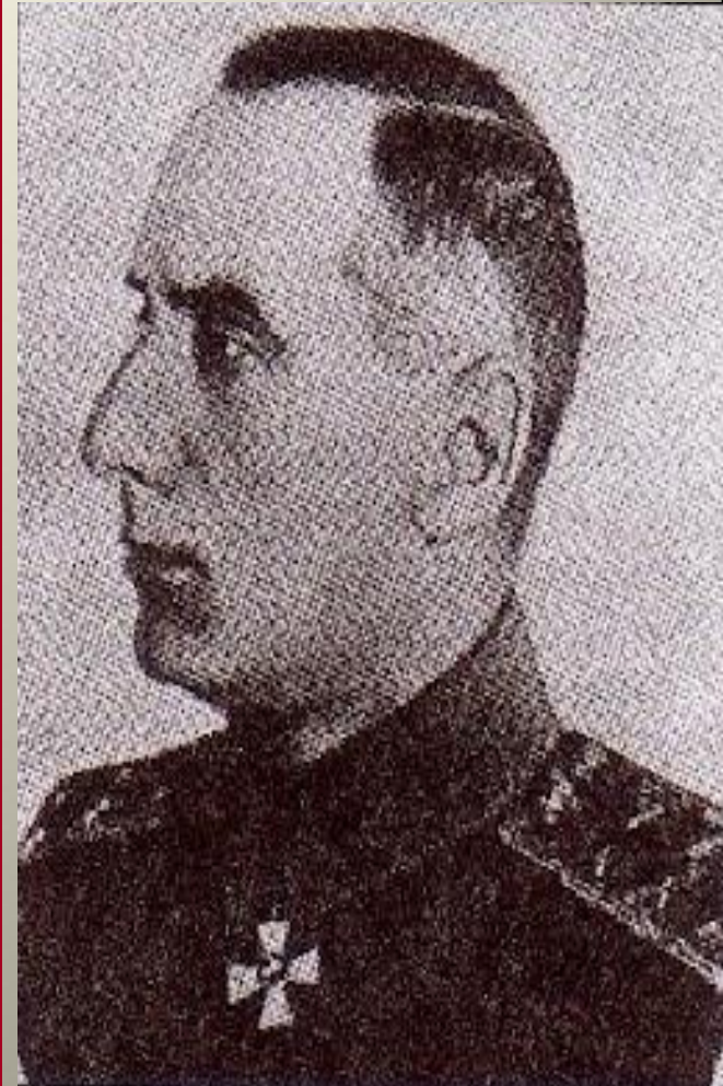
А. В. Колчак

Колчак Александр Васильевич (1873—1920) — с лета 1916 г. — командующий Черноморским флотом. После Февральской революции 1917 г. отказался сотрудничать с Советами и Временным правительством, эмигрировал в Англию и служил в английском флоте. Был признан державами Антанты в качестве Верховного правителя России. Обещал им выплатить долги царского и Временного правительств. В 1920 г. Колчак отказался от титула Верховного правителя России и пытался бежать, намереваясь вывезти с собой золотой запас России, но был взят в плен и расстрелян. Поиски золота (несколько сот тонн), захваченного Колчаком, до сих пор не