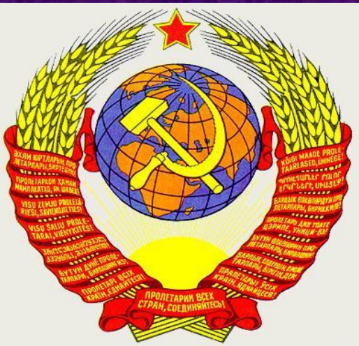
Флаг и герб СССР

Большевики собрали большую часть территории Российской империи в единое государство. Начался очередной этап развития Российского государства теперь уже в форме Союза Советских Социалистических Республик.