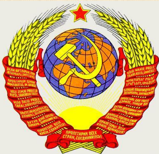
Флаг и герб СССР

Большевики собрали большую часть территории Российской империи в единое государство. Начался очередной этап развития Российского государства теперь уже в форме Союза Советских Социалистических Республик.