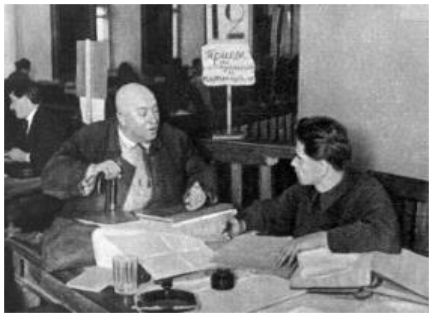
Нэпман на приеме у фининспектора

Между экономической и политической системой, рассчитанной на использование административно-командных методов управления и было главное противоречие.