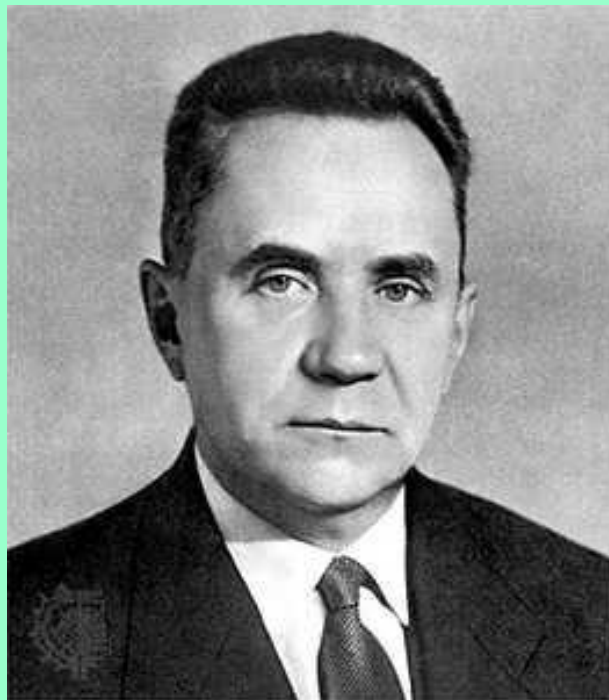
А. Н. Косыгин

«...Повесть о том, как целые предприятия и миллионы людей были вывезены на восток, как эти предприятия были в кратчайший срок и в неслыханно трудных условиях восстановлены и как им удалось в огромной степени увеличить производство в течение 1942 года - это прежде всего повесть о невероятной человеческой стойкости ...»