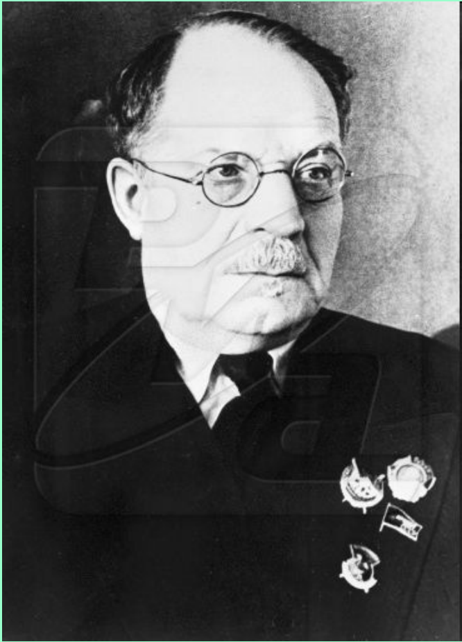
Николай Бурденко – разработчик НОВЫХ методов лечения ранений