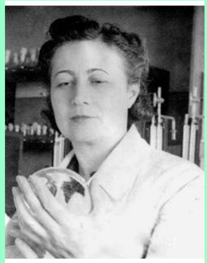
Зинаида Ермольева – «автор» отечественного пенициллина