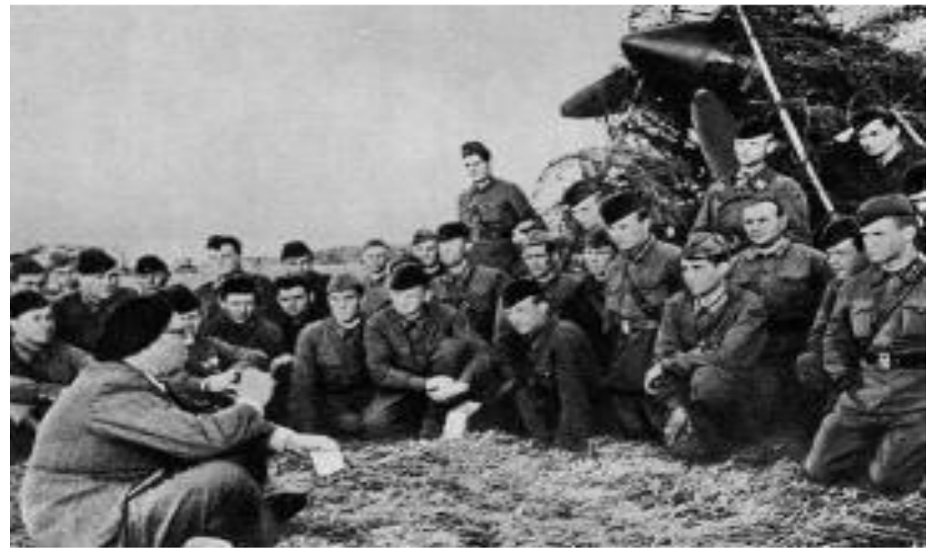
Писатель А. Толстой выступает перед солдатами