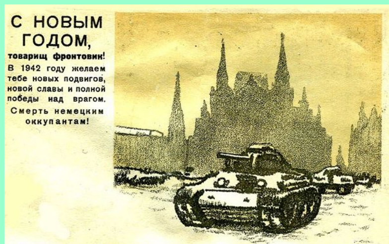
Новогодняя открытка для фронтовика