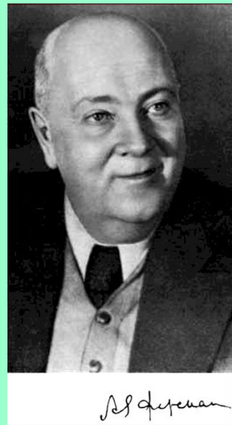
А. Ферсман – руководитель Комиссии научной помощи Советской Армии при отделении геолого-географических наук АН СССР