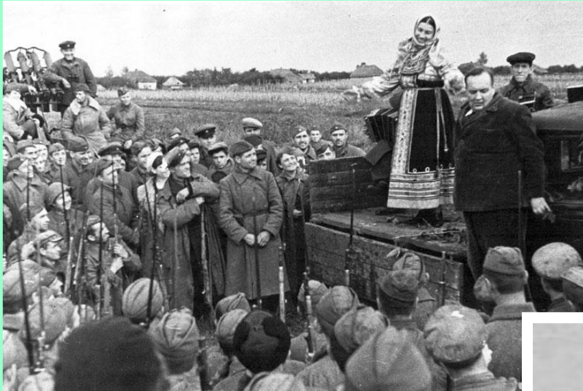
Выступление фронтовой бригады