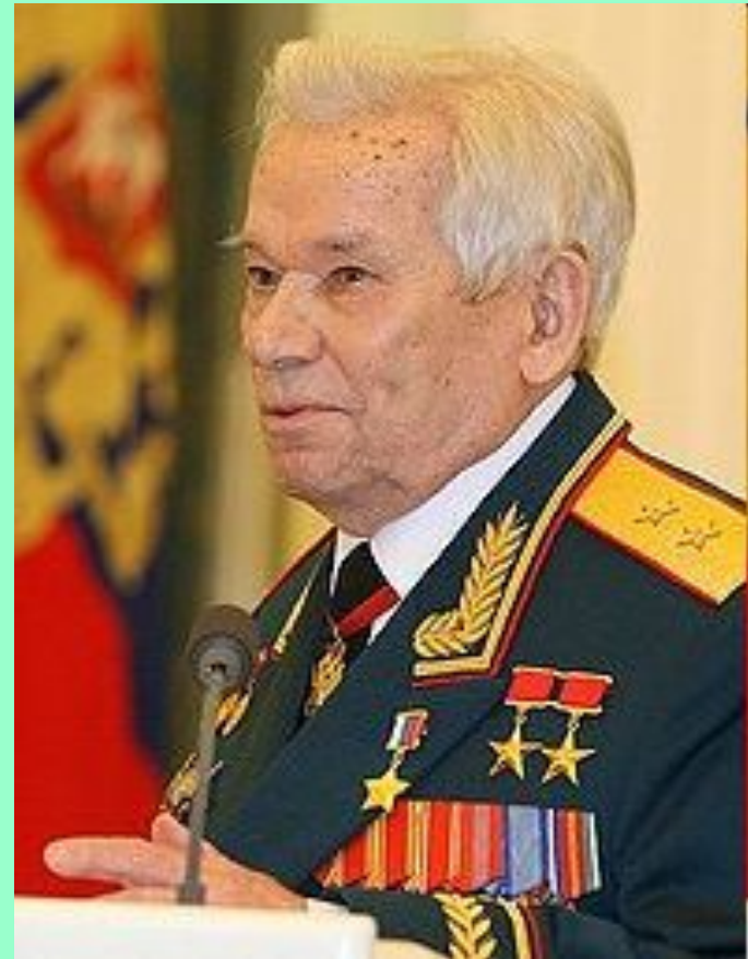
Михаил Тимофеевич Калашников