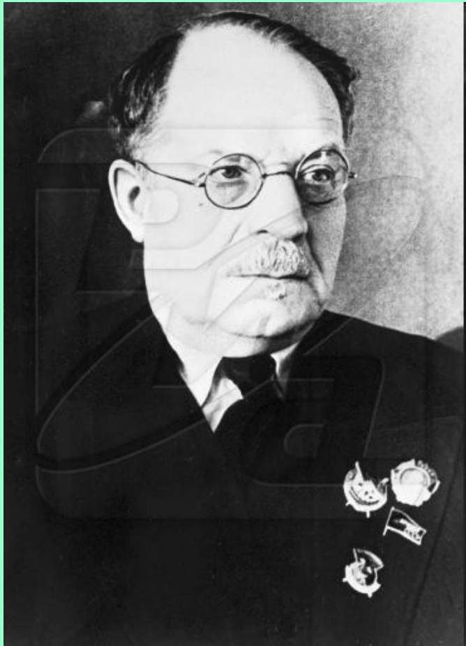
Николай Бурденко – разработчик НОВЫХ методов лечения ранений