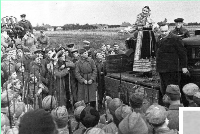
Выступление фронтовой бригады

Писатель А. Толстой выступает перед солдатами