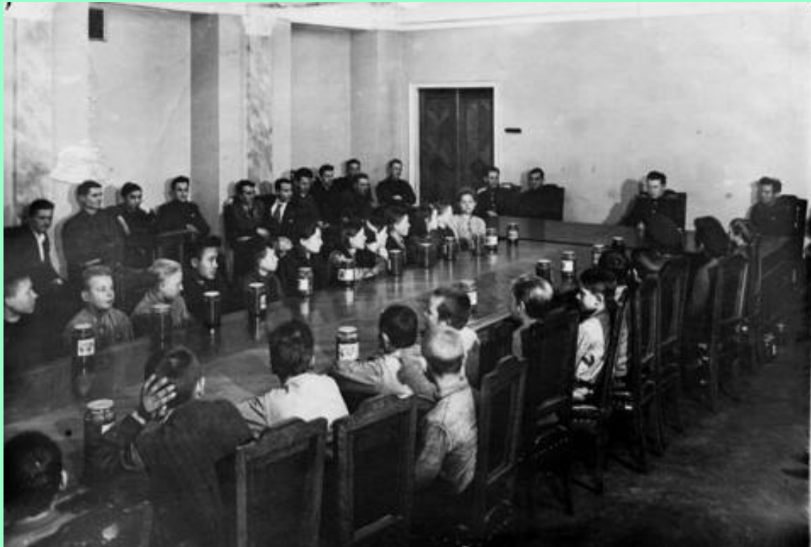
Пермь, 1944 год