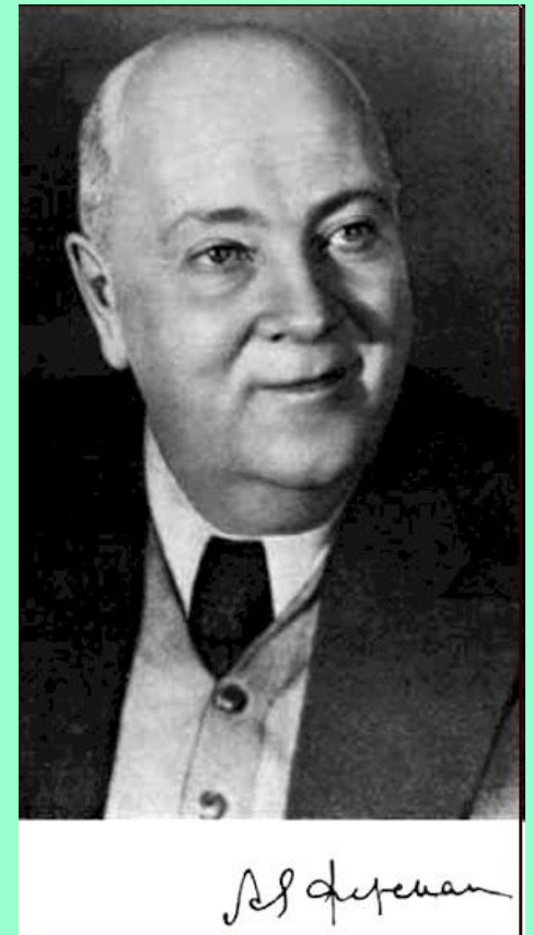
А. Ферсман – руководитель Комиссии научной помощи Советской Армии при отделении геолого-географических наук АН СССР