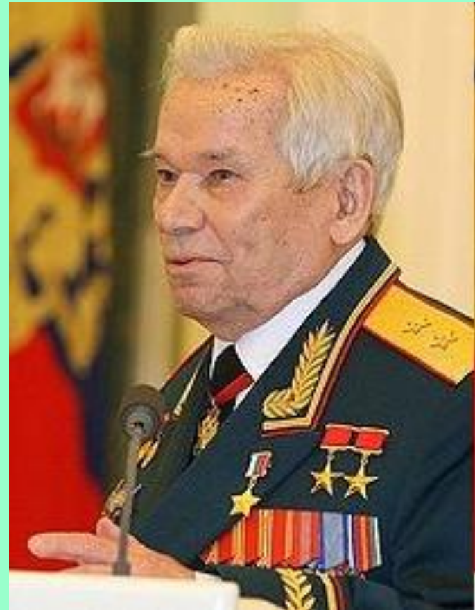
Михаил Тимофеевич Калашников