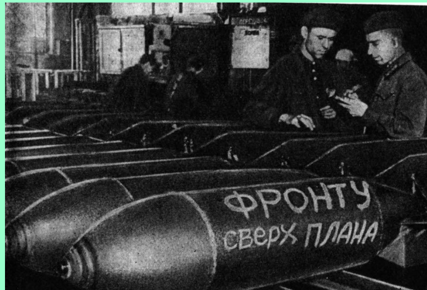
Работа на эвакуированных предприятиях