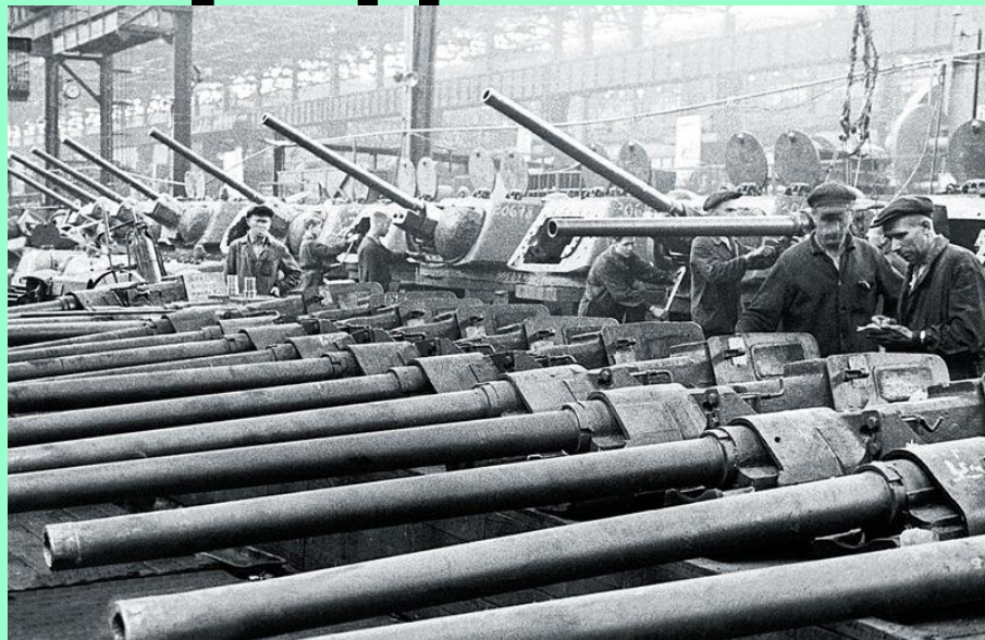
Сборка танков на Челябинском тракторном заводе

К осени 1942 года на Урале работало более 830 эвакуированных предприятий