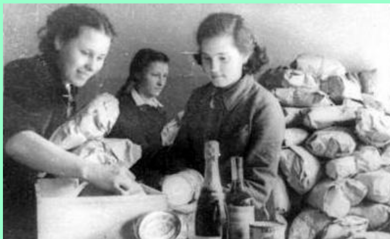
Посылки на фронт