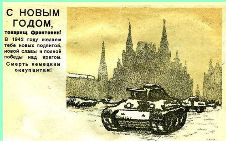
Новогодняя открытка для фронтовика