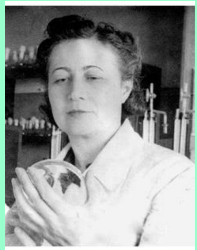
Зинаида Ермольева – «автор» отечественного пенициллина