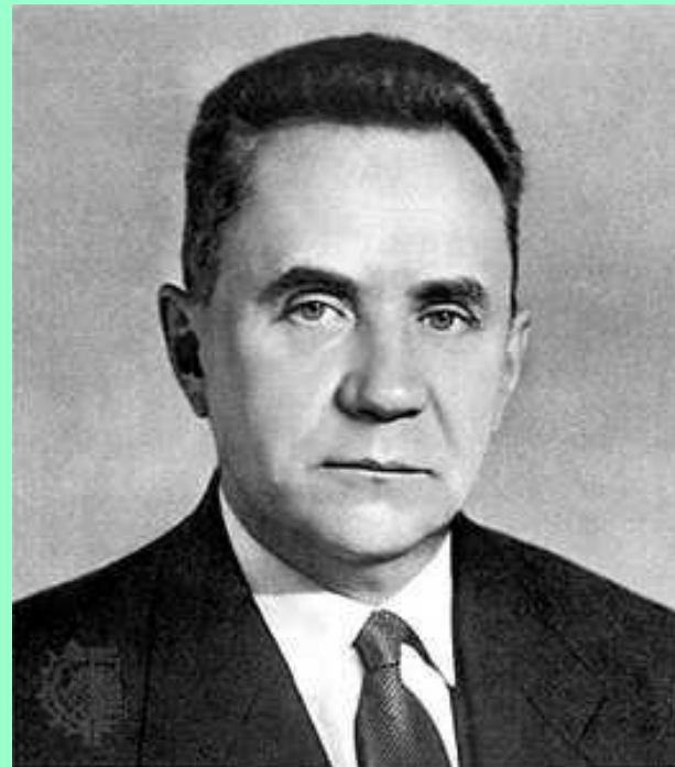
А. Н. Косыгин

«...Повесть о том, как целые предприятия и миллионы людей были вывезены на восток, как эти предприятия были в кратчайший срок и в неслыханно трудных условиях восстановлены и как им удалось в огромной степени увеличить производство в течение 1942 года - это прежде всего повесть о невероятной человеческой стойкости ...»