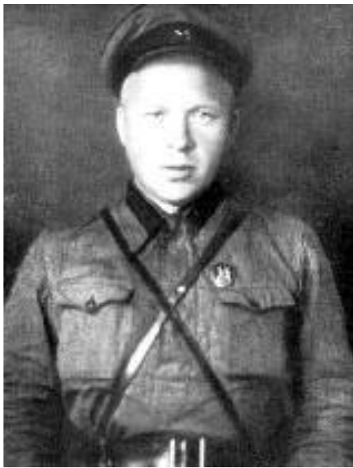
А.П.Гайдар на фронте

С первых дней войны тысячи деятелей советской культуры ушли на фронт. Защищая Родину погибли А.Гайдар и Е. Петров. Фронтowymi корреспондентами работали М.Шолохов, К.Симонов, А.Фадеев и др. В осажденном Ленинграде продолжали работать О. Бергольц, В.Инбер, Д. Шостакович. События тех дней нашли отражение во «Фронтowych дневниках» К.Симонова, И.Эрен