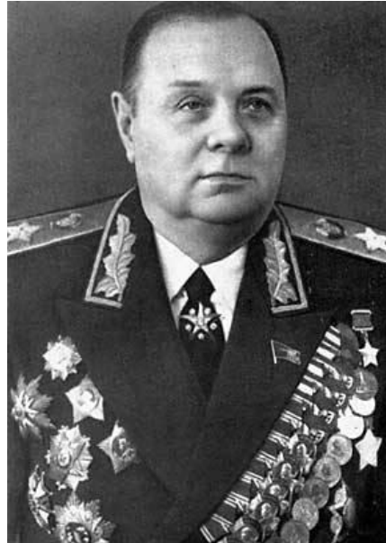
Кирилл Афанасьевич Мерецков. 1-й Дальневосточный фронт