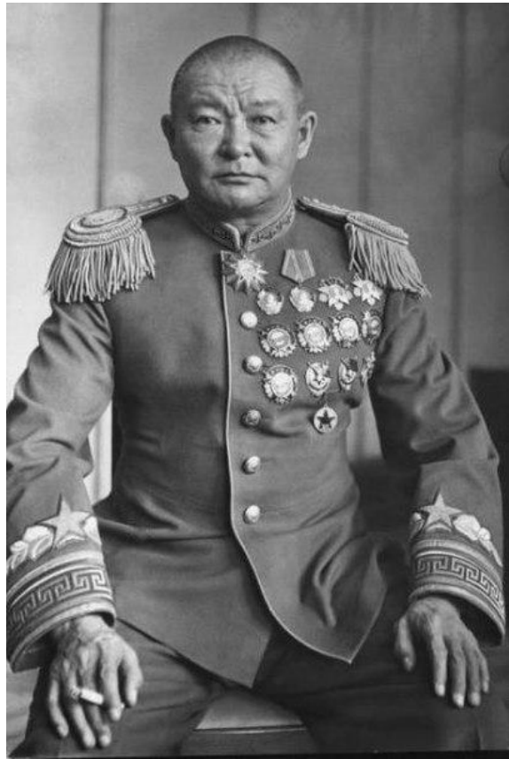
Хорлогийн Чойбалсан. Командир монгольских войск