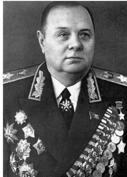
Кирилл Афанасьевич Мерецков. 1-й Дальневосточный фронт