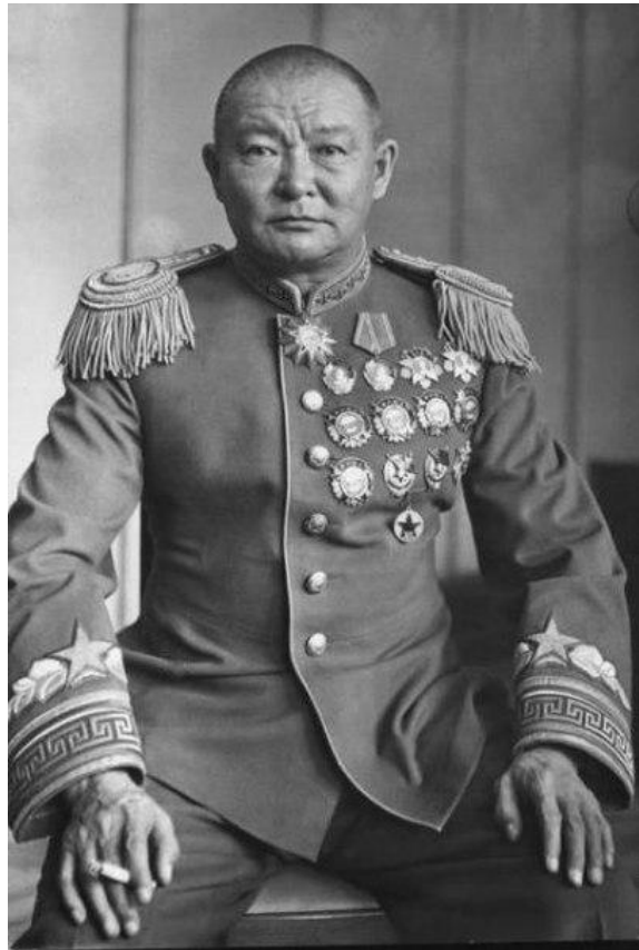
Хорлогийн Чойбалсан. Командир монгольских войск