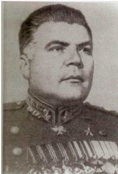
Родион Яковлевич Малиновский. Забайкальский фронт