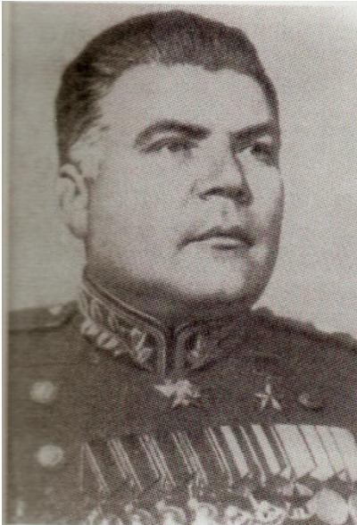
Родион Яковлевич Малиновский. Забайкальский фронт