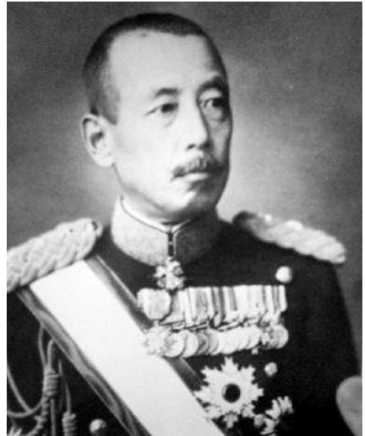
Отодзо Ямада. Командующий Квантунской армией