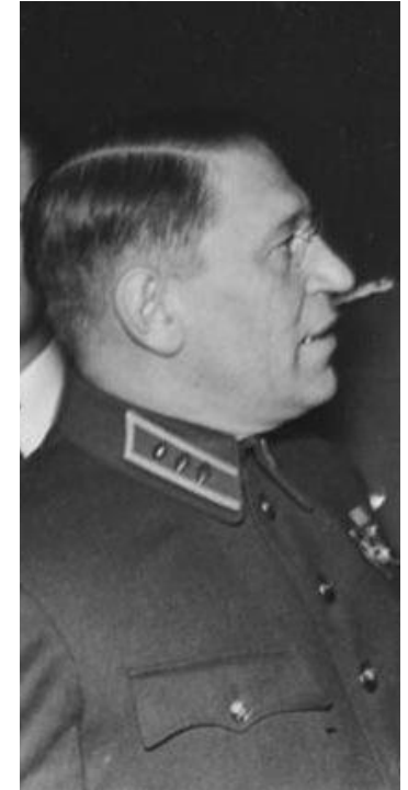
Максим Алексеевич Пуркаев. 2-й Дальневосточный фронт