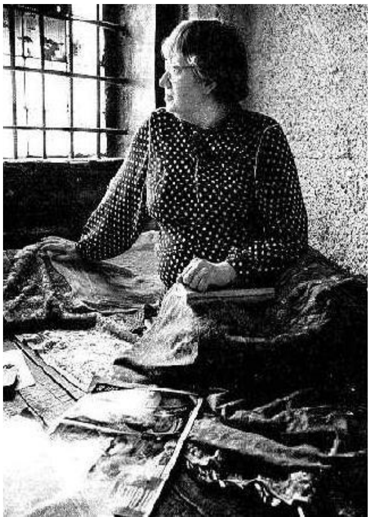
В.Новодворская в тюрьме.

13 марта 1954 ,(КГБ) СССР — союзно-республиканский орган государственного управления в сфере обеспечения государственной безопасности при Совете Министров СССР. В 1965 г создание при КГБ специальной структуры (Пятого управления), ориентированной на обеспечение контроля за умонастроениями и "профилактику" диссидентов;