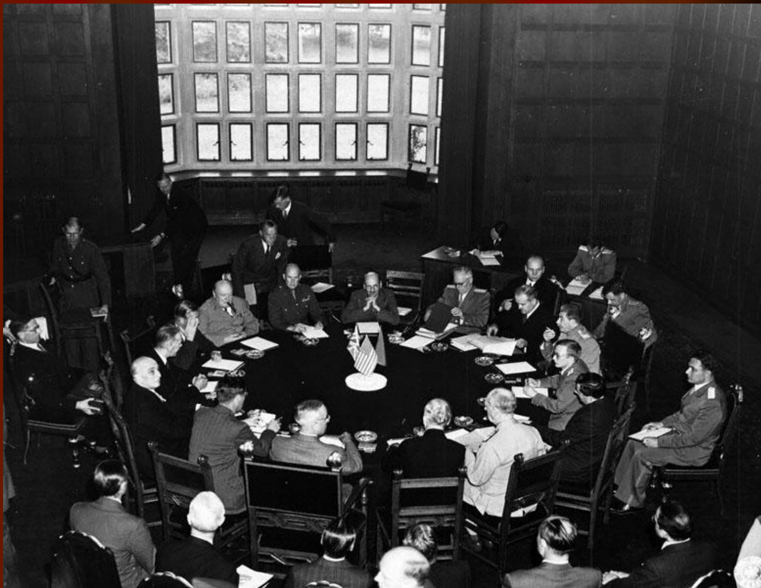
На одном из первых заседаний Берлинской (Потсдамской) конференции. Присутствуют: И.В. Сталин, У. Черчилль, Г. Трумэн