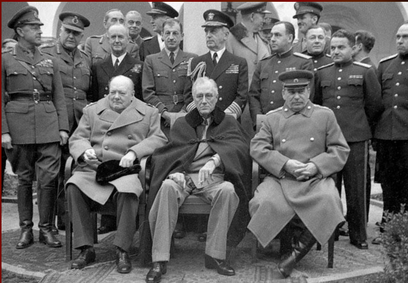
У. Черчилль, Ф.Д. Рузвельт, И.В. Сталин