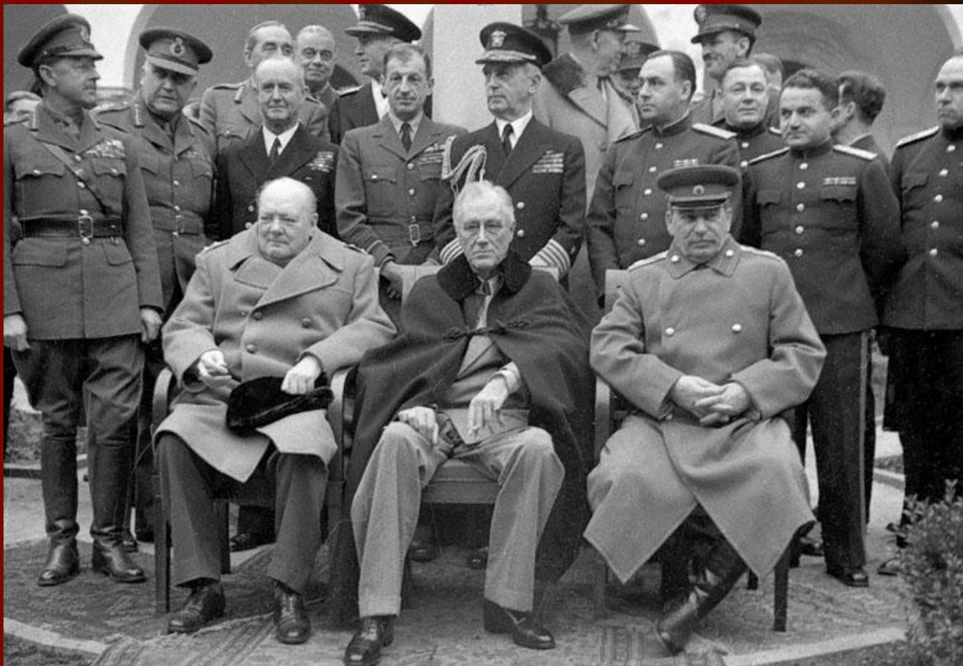
У. Черчилль, Ф.Д. Рузвельт, И.В. Сталин