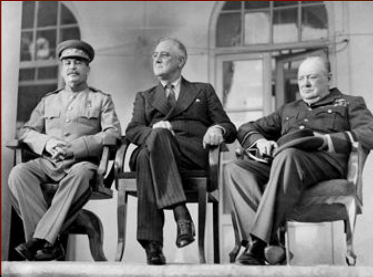
И.В. Сталин, Ф.Д. Рузвельт, У. Черчилль