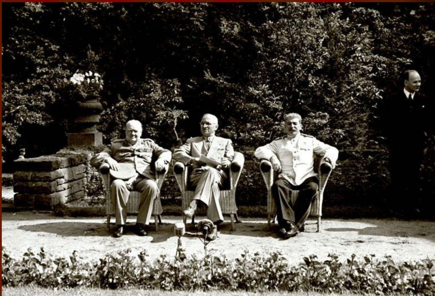
У. Черчилль, Г. Трумэн, И.В. Сталин