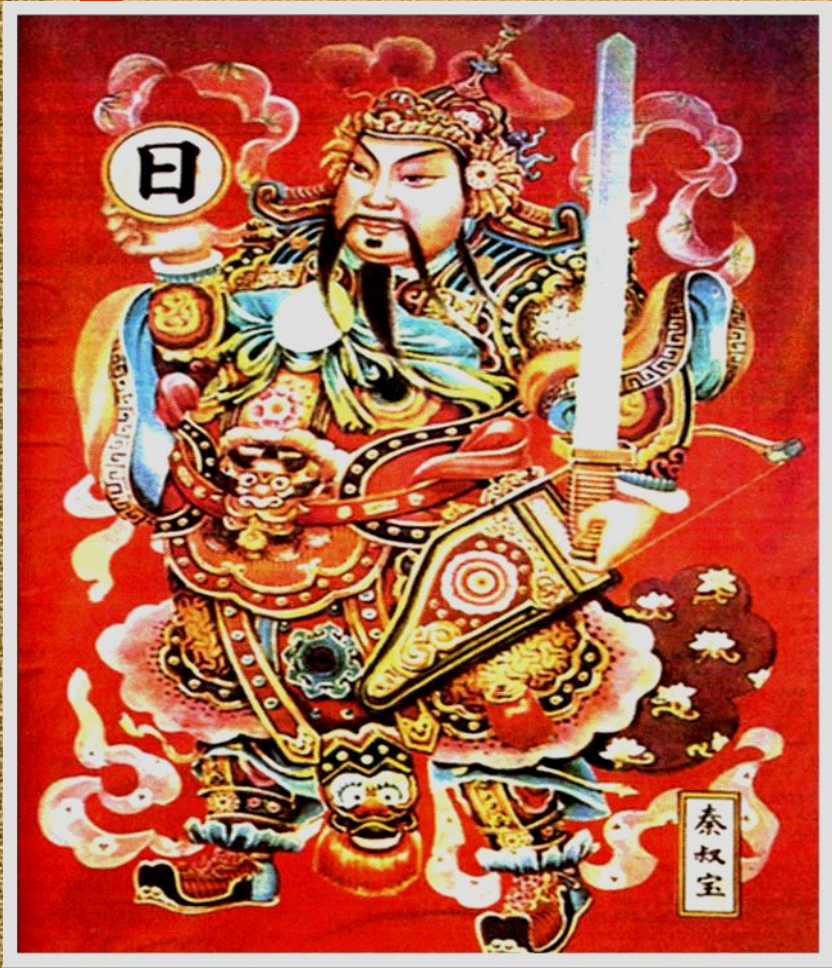
Цинь Шихуань. Древнекитайский рисунок по шелку.

До 3 в. до н.э.в Китае существовало 7 царств.