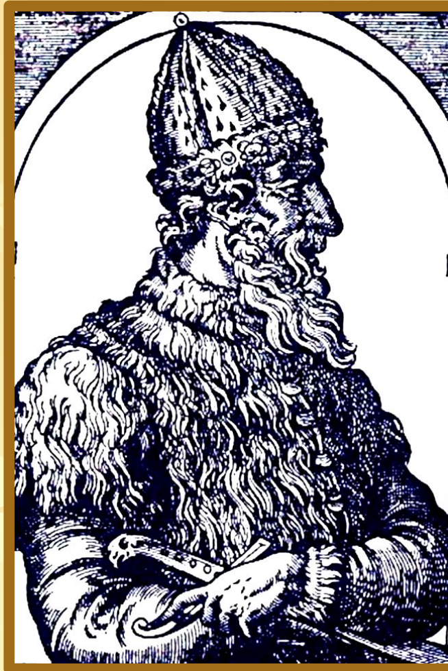
Иван III. Средневековая гравюра.