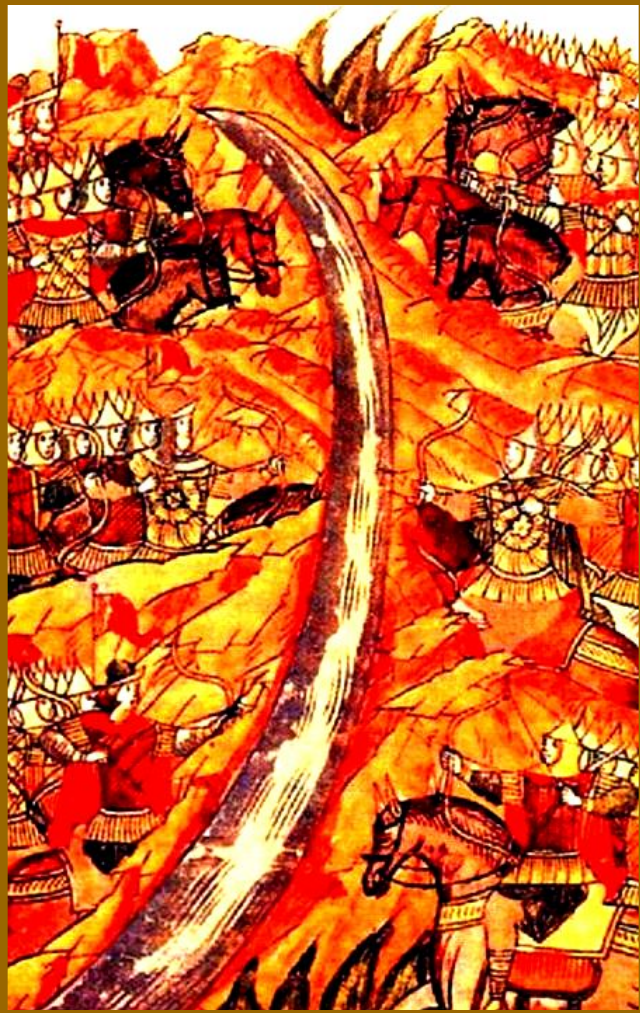
Стояние на реке Угре. Средневековая миниатюра.