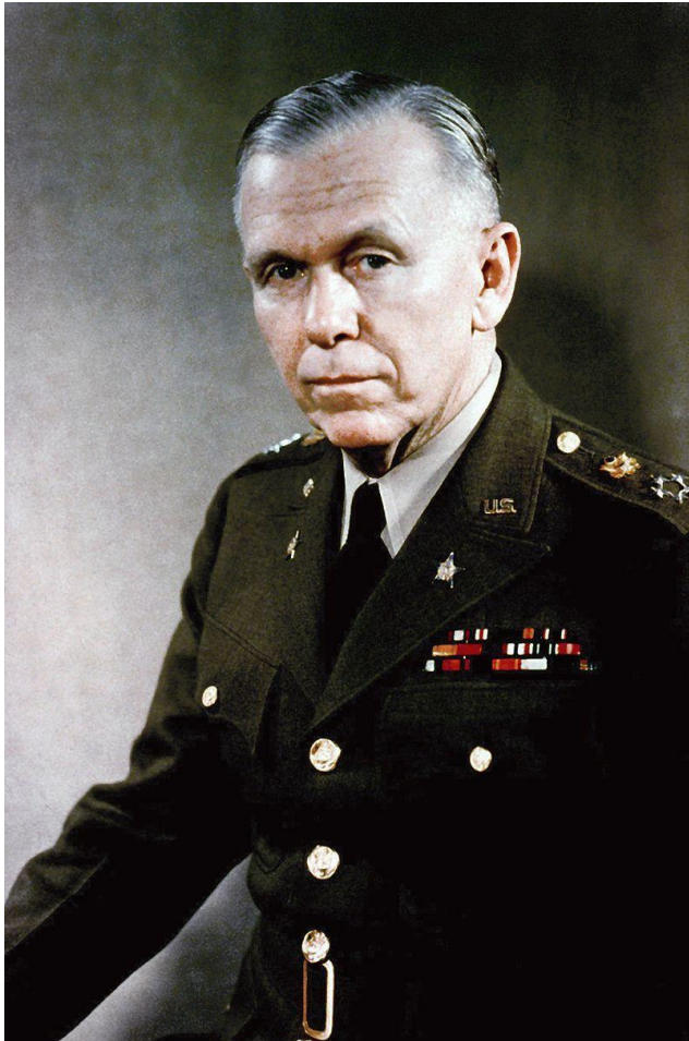
Джордж Кэтлетт Маршалл-мл. (1880-1959)