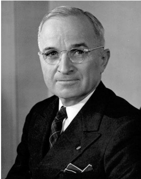
Гарри Трумэн (1884-1972)