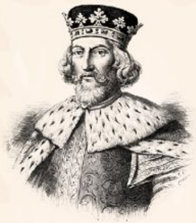
Король Англии. Иоанн Безземельный