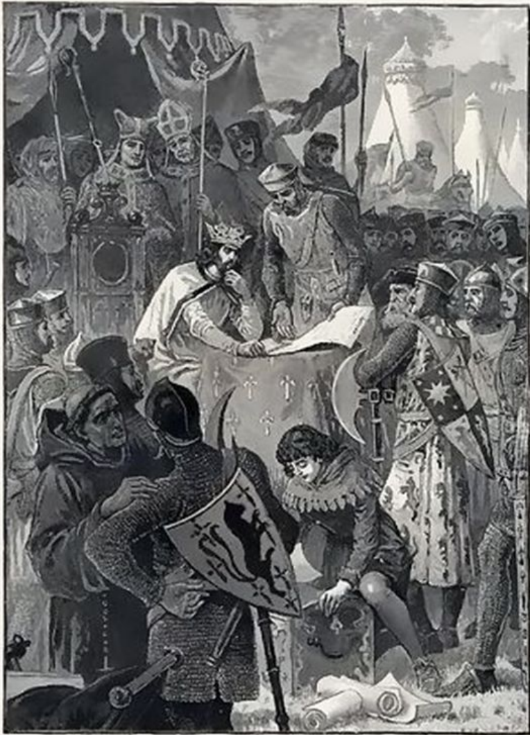
KING JOHN SIGNING THE GREAT CHARTER. (See p. 208.)