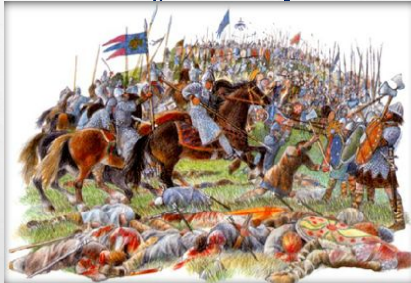
Битва при Гастингсе

В 1066 году Вильгельм, герцог Нормандии, переправился через Ла-Манш и 28 сентября высадился со