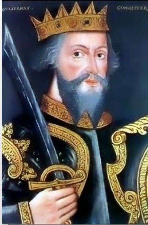
Вильгельм Завоеватель (1027/1028 – 1087)

В 1066 году Вильгельм, герцог Нормандии, переправился через Ла-Манш и 28 сентября высадился со