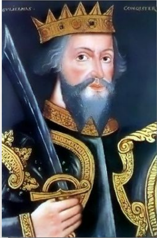
Вильгельм Завоеватель (1027/1028 – 1087)

В 1066 году Вильгельм, герцог Нормандии, переправился через Ла-Манш и 28 сентября высадился со