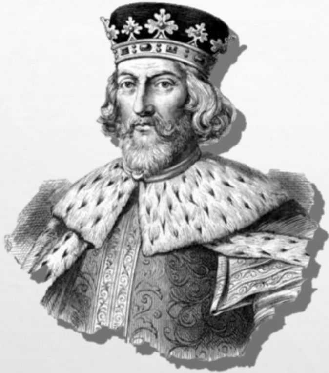
Иоанн Безземельный (1199-1216)