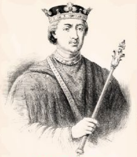
Король Франции. Филипп II Август

Король Франции Филипп II Август (1180–1223 гг.) мечтал вернуть земли Плантагенетов французской короне.