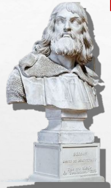
Симон де Монфор

В 1258 году возмущенные бароны собрали в Оксфорде королевский совет, получивший название «бешеного совета». Их поддержали 60 тысяч вооруженных людей. Король вынужден был пойти на уступки: