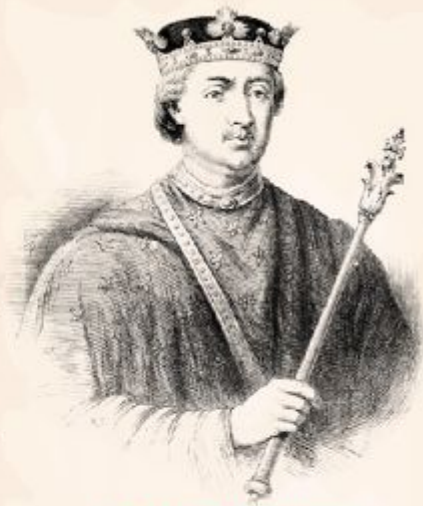
Король Франции. Филипп II Август

Король Франции Филипп II Август (1180–1223 гг.) мечтал вернуть земли Плантагенетов французской короне.