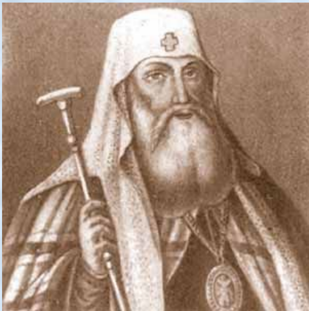
Гермоген - патриарх всероссийский с 1606 по 1612 г