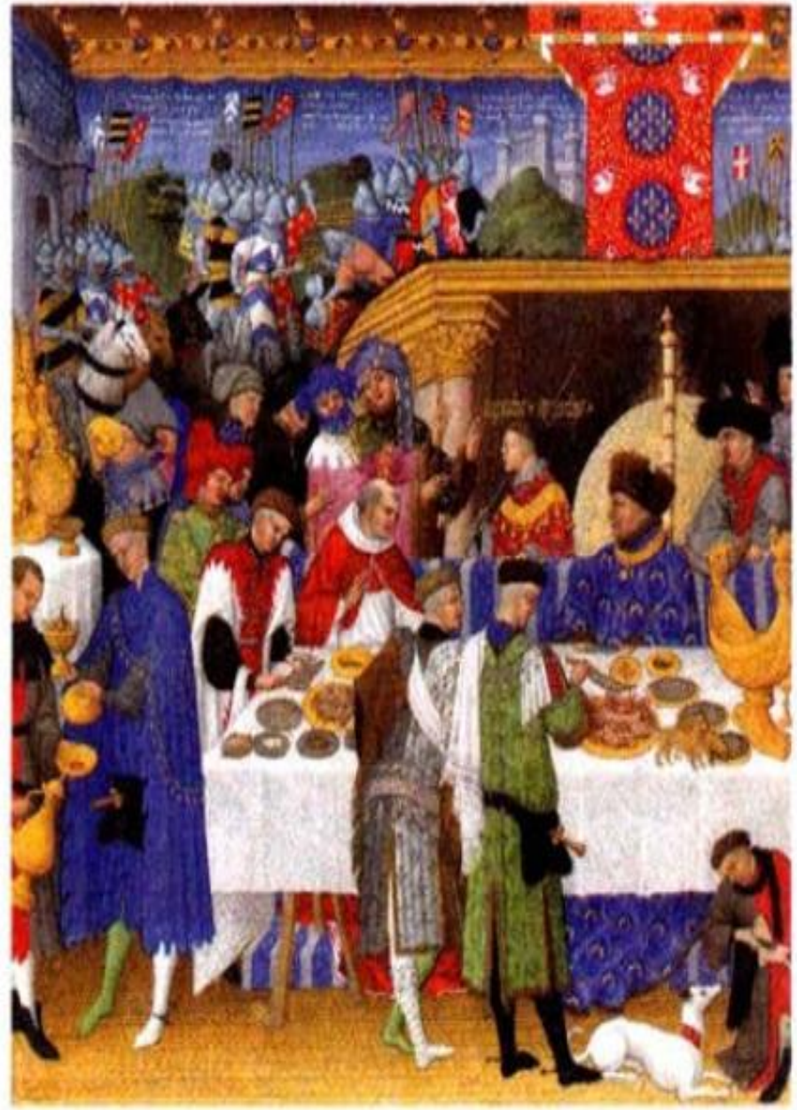
Пир у знатного сеньора. Средневековая миниатюра