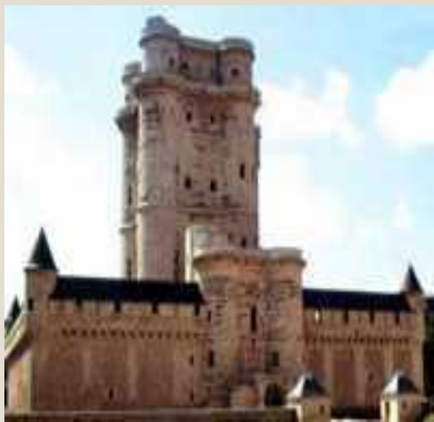
Донжон в замке Венсенн.