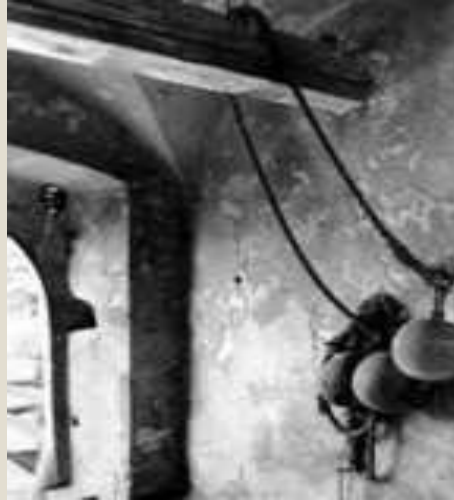
Противовесы на подъемнике ворот