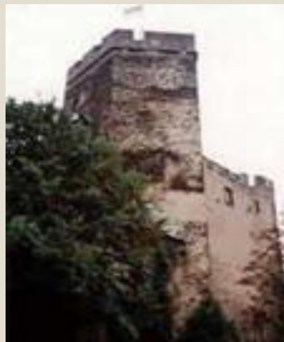
Пятиугольная башня замка Лаэнк.