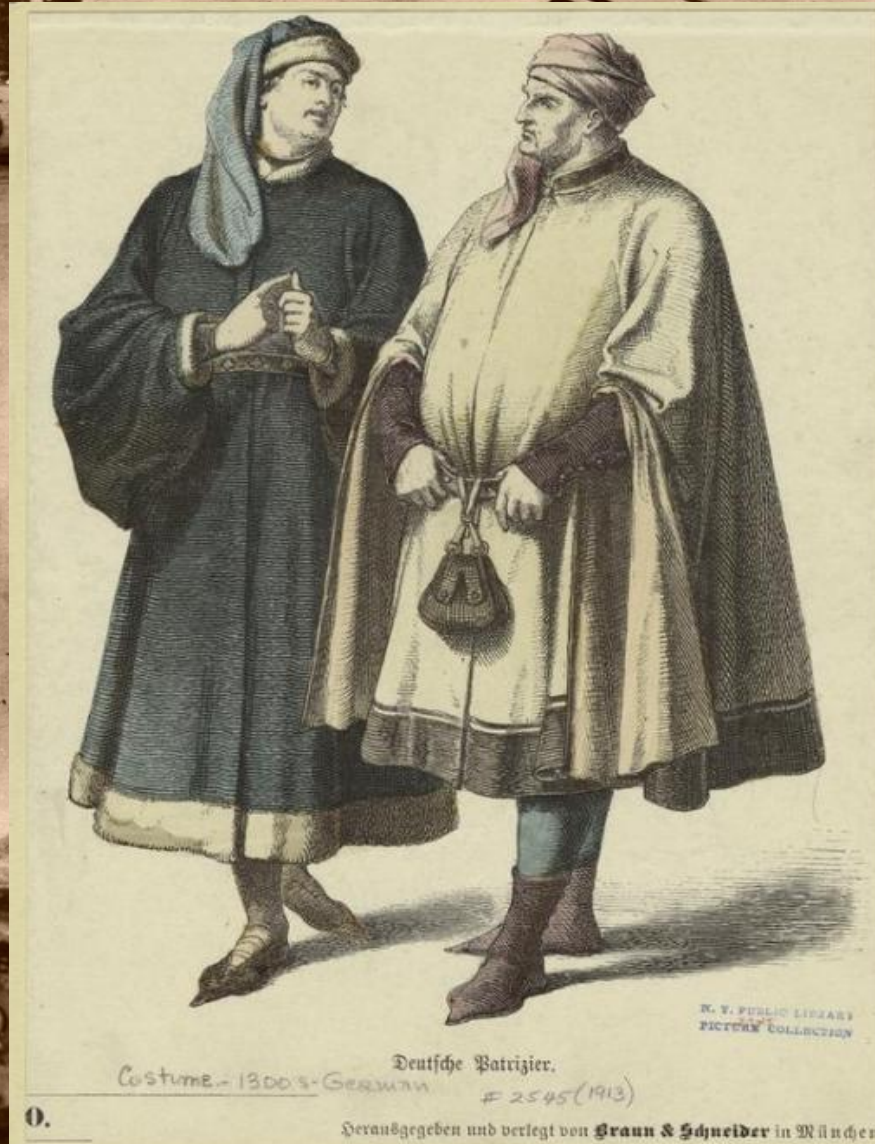
Deutsche Patrizier. Costume - 1300's - German # 2545 (1913)