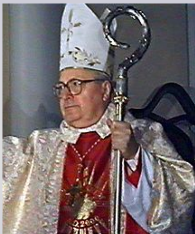
Западная (католическая) церковь