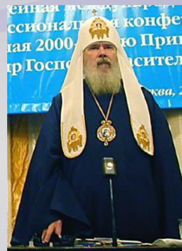
Восточная (православная) церковь