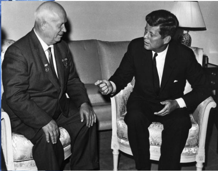
Никита Хрущёв и Джон Кеннеди Ведут мирные переговоры

Мир оказался на грани войны. Лидеры двух стран сумели сделать по шагу от края пропасти и урегулировать конфликт. Советские ракеты были вывезены с Кубы, США сняли морскую блокаду острова и убрали часть своих ракет из Турции.