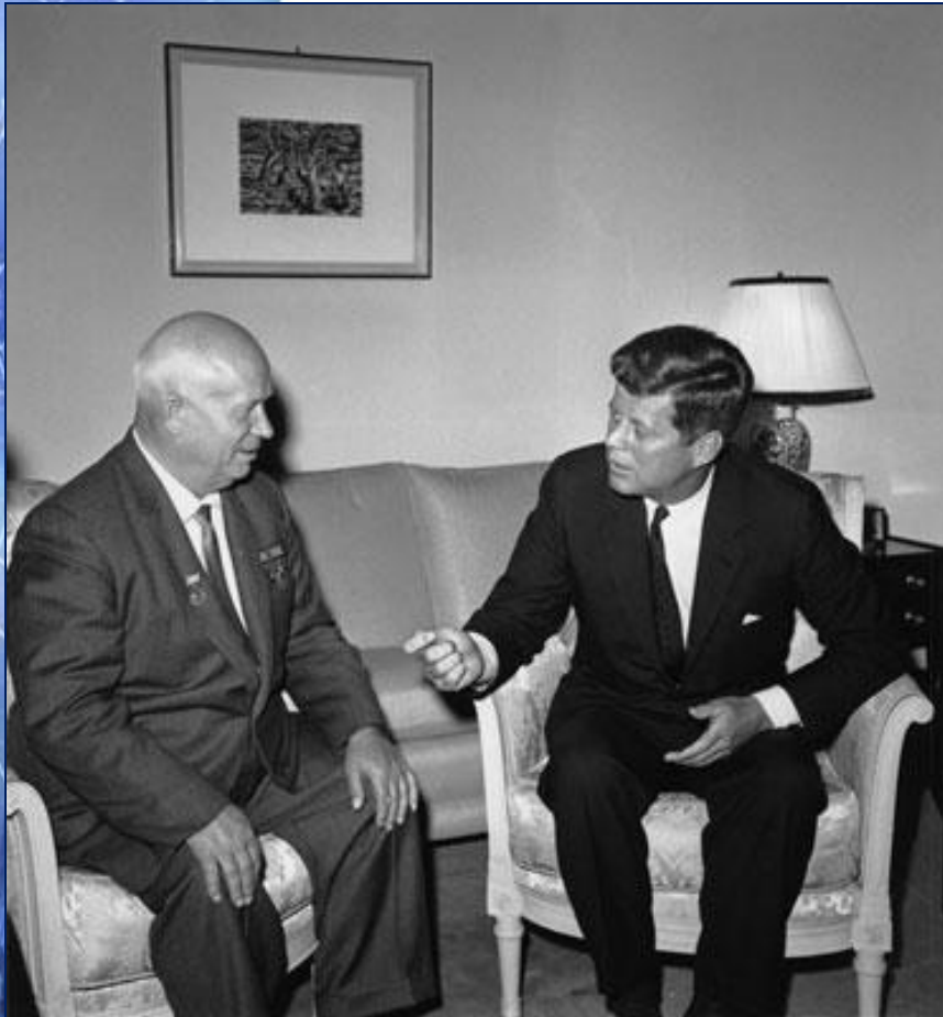
Кеннеди и Н.Хрущев.

Во внешней политике Кеннеди продолжил конфронтацию с СССР и соц.лагерем. При нем произошел в 1962 г. « карибский кризис ». Во внутренней политике Кеннеди был сторонником кейнсианства /гос.регулирования экономики/.