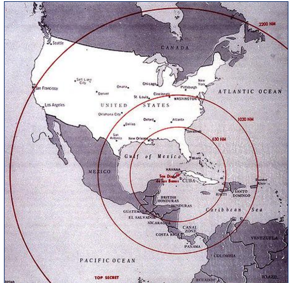
Карибский кризис 1962 г.