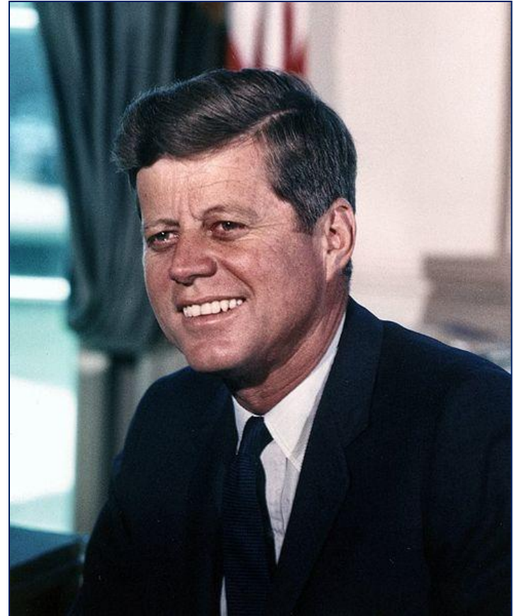
Президент Д.Кеннеди. 1960- 1963 гг.