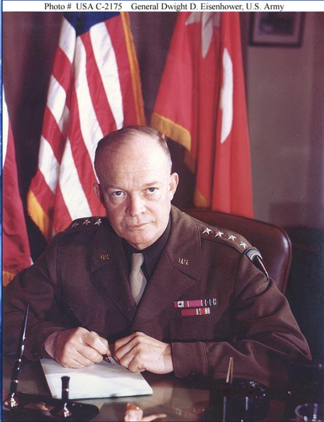
Президент Д.Эйзенхауэр. 1952- 1960 гг.

Photo # USA C-2175 General Dwight D. Eisenhower, U.S. Army