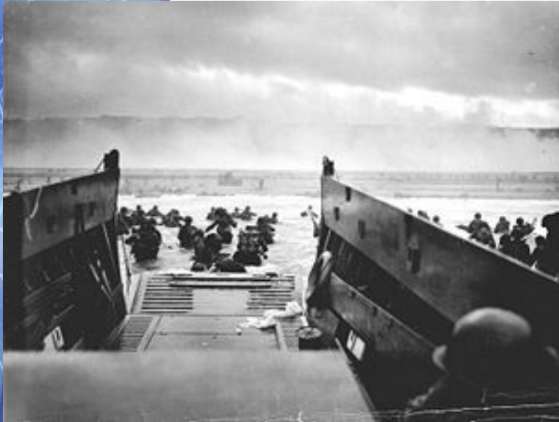
Американские солдаты на пляже Омаха в Нормандии. 6 июня 1944