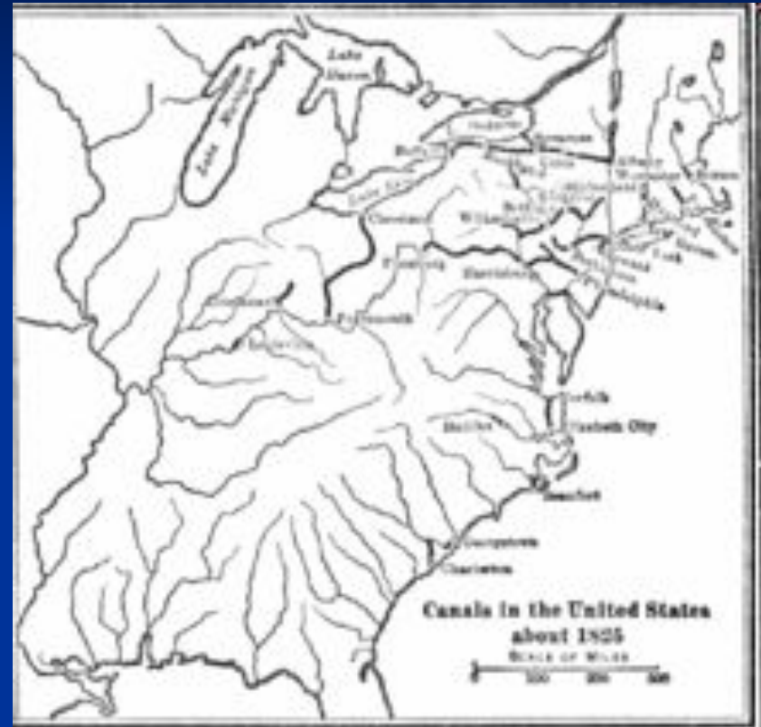
Каналы в США к 1825 г.

Аналогично было создано множество компаний для строительства каналов. К 1812 г. их было построено только три, в Виргинии, Южной Каролине и Массачусетсе. В 1817 г. был построен канал Эри, соединивший реку Гудзон с Великими озерами. В 1825 г. законодательное собрание штата Пенсильвания приняло решение о строительстве сети каналов, соединяющих Филадельфию с западными регионами и Великими озерами. До 1848 г. сеть каналов соединяла штаты от Массачусетса до Иллинойса. Многие каналы были финансово успешными, но некоторые едва не довели штаты Огайо, Пенсильвания и Индиана до банкротства.