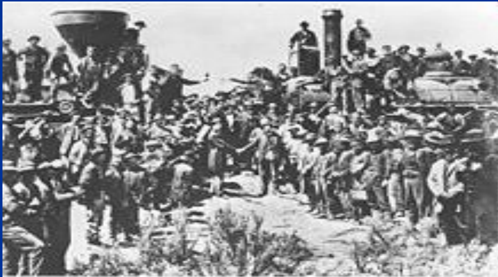
Конец XIX века