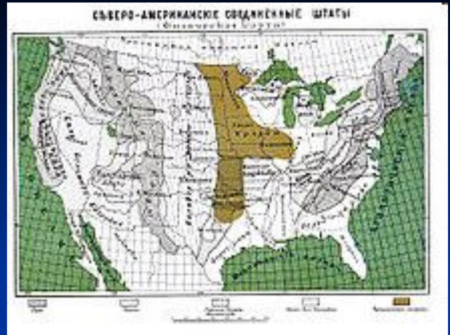
Конец XIX века