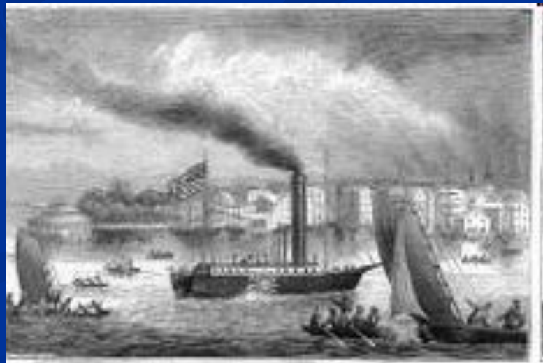
Фултоновский «Пароход Северная река» на Гудзоне

После гражданской войны в США активно строились железные дороги, линии телеграфной и телефонной связи, а к началу XX в. появился и двигатель внутреннего сгорания. Эти инновации существенно облегчили освоение и экономическое развитие западных территорий.