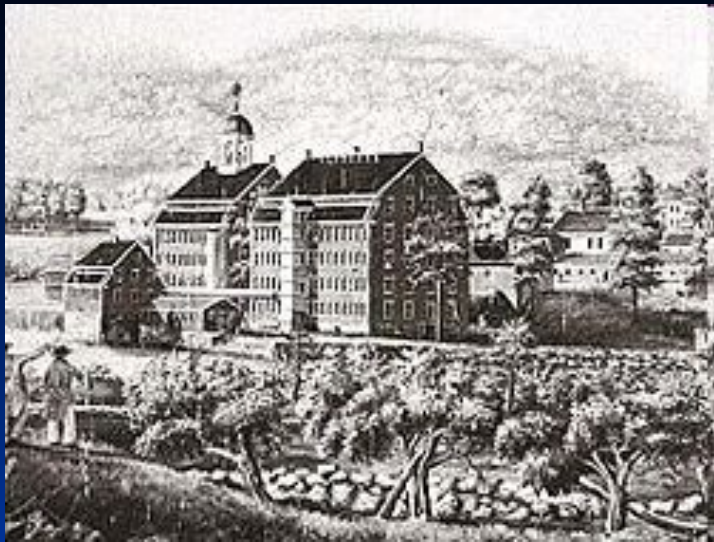
Текстильная фабрика в Бостоне, созданная в 1813 г.