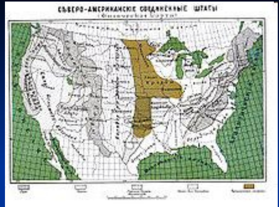
Конец XIX века