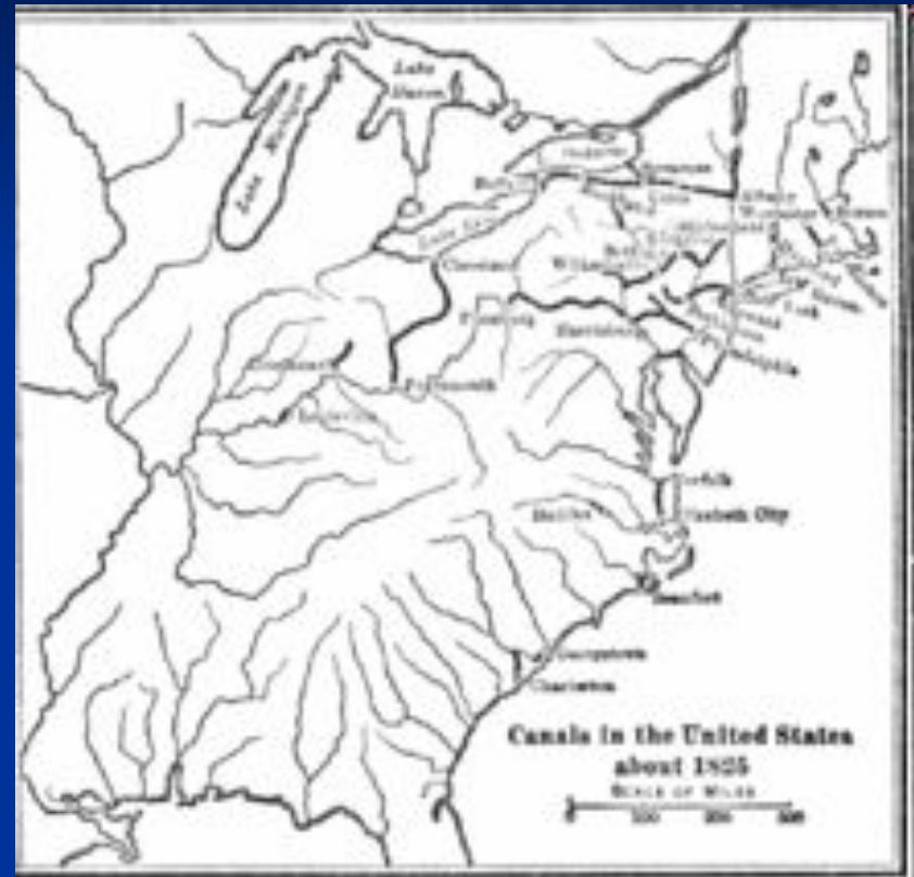
Каналы в США к 1825 г.

Аналогично было создано множество компаний для строительства каналов. К 1812 г. их было построено только три, в Виргинии, Южной Каролине и Массачусетсе. В 1817 г. был построен канал Эри, соединивший реку Гудзон с Великими озерами. В 1825 г. законодательное собрание штата Пенсильвания приняло решение о строительстве сети каналов, соединяющих Филадельфию с западными регионами и Великими озерами. До 1848 г. сеть каналов соединяла штаты от Массачусетса до Иллинойса. Многие каналы были финансово успешными, но некоторые едва не довели штаты Огайо, Пенсильвания и Индиана до банкротства.