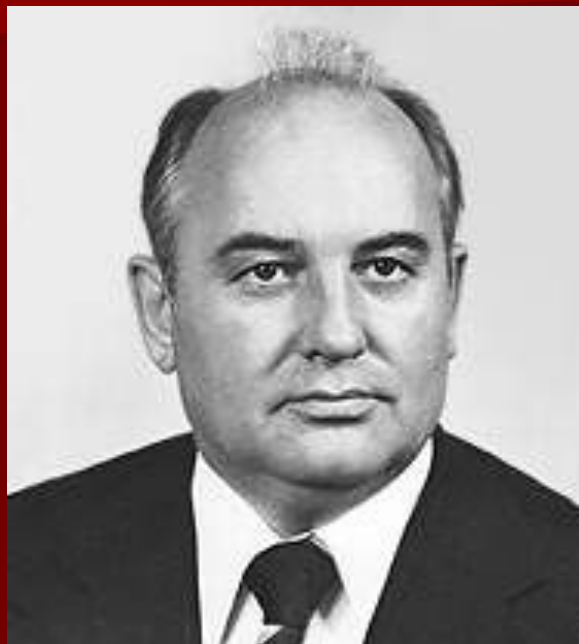
Президент СССР Горбачев М.С.