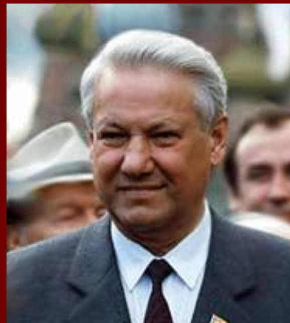
Первый президент России Ельцин Б.С.