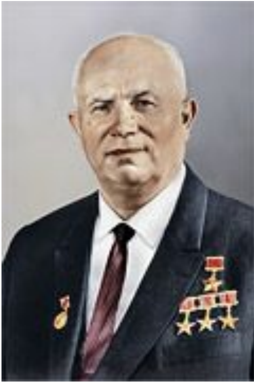
Н.С.Хрущев(1894-1971) Секретарь ЦК КПСС, Член Политбюро ЦК КПСС