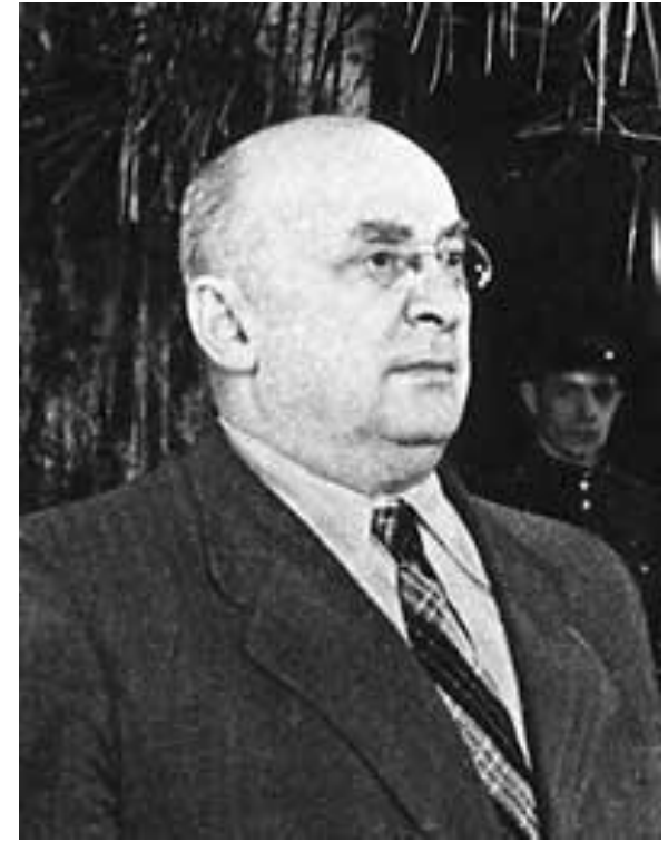
Л.П.Берия(1899-1953) Член Политбюро ЦК КПСС, заместитель Председателя Совета Министров СССР