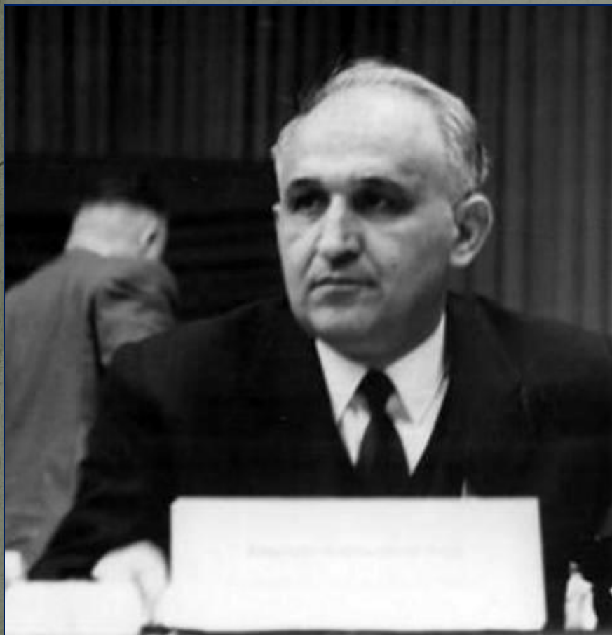
«Отец всех болгар» Тодор Живков. Правитель Болгарии с 1954 по 1989 гг.

«Реальный социализм» оказался тупиковой ветвью развития. К концу 80-х гг. в связи с перестройкой в СССР в странах Восточной Европы проходят «бархатные революции» свергающие коммунистические правительства.