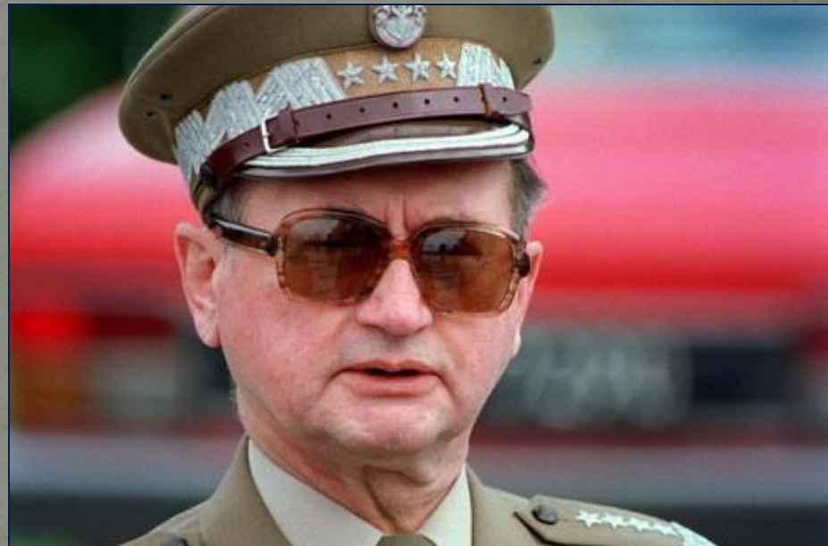
Генерал Войцех Ярузельский, введший в Польше ЧП и правившей ею с 1981 по 1990 г.