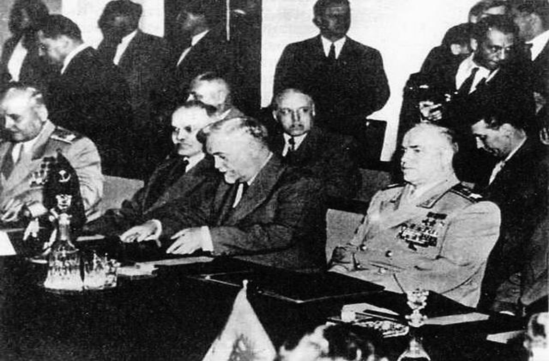
Подписание договора об образовании ОВД. 1955 г.