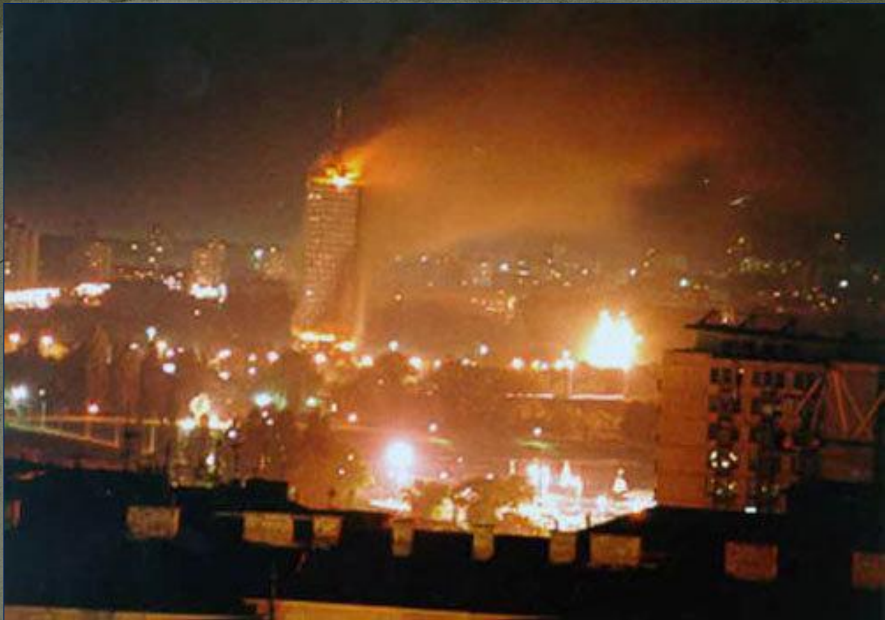
Воздушный удар авиации НАТО по Белграду, столице Югославии. 1998 г.