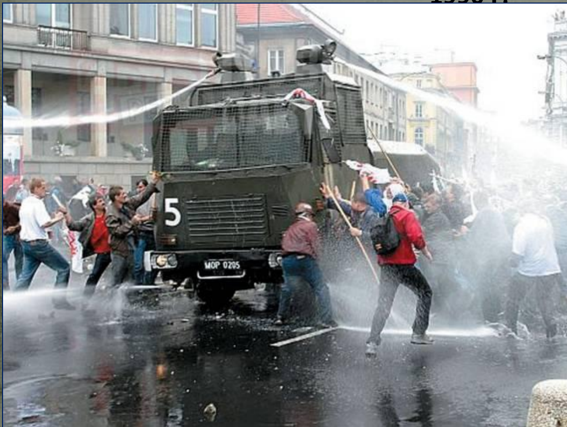
Польша. 1990 г.

Летом 1989 г. началась революция в ГДР, закончившаяся падением Берлинской стены. Реформы начались в Польше, Венгрии, Болгарии, Албании, Чехословакии. Электрик Л.Валенса, лидер профсоюза «Солидарность» становится президентом Польши в 1990 г.