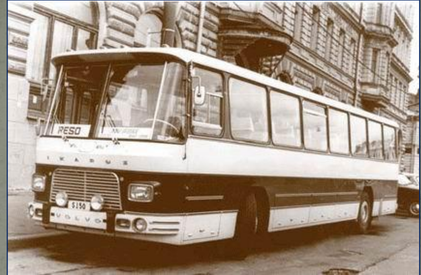
Флагман индустриализации социалистического лагеря, автобус «ИКАРУС».