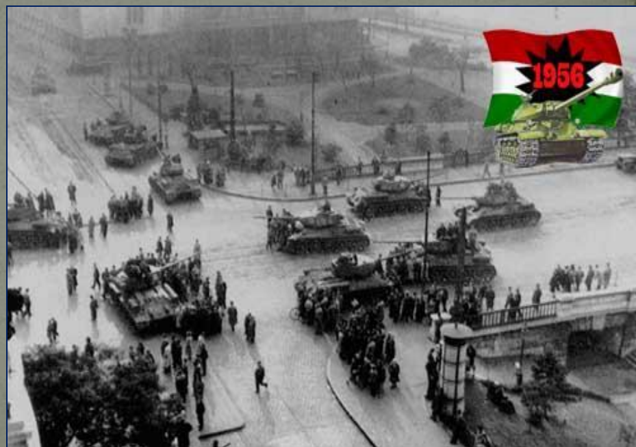
Венгрия. 1956 г.