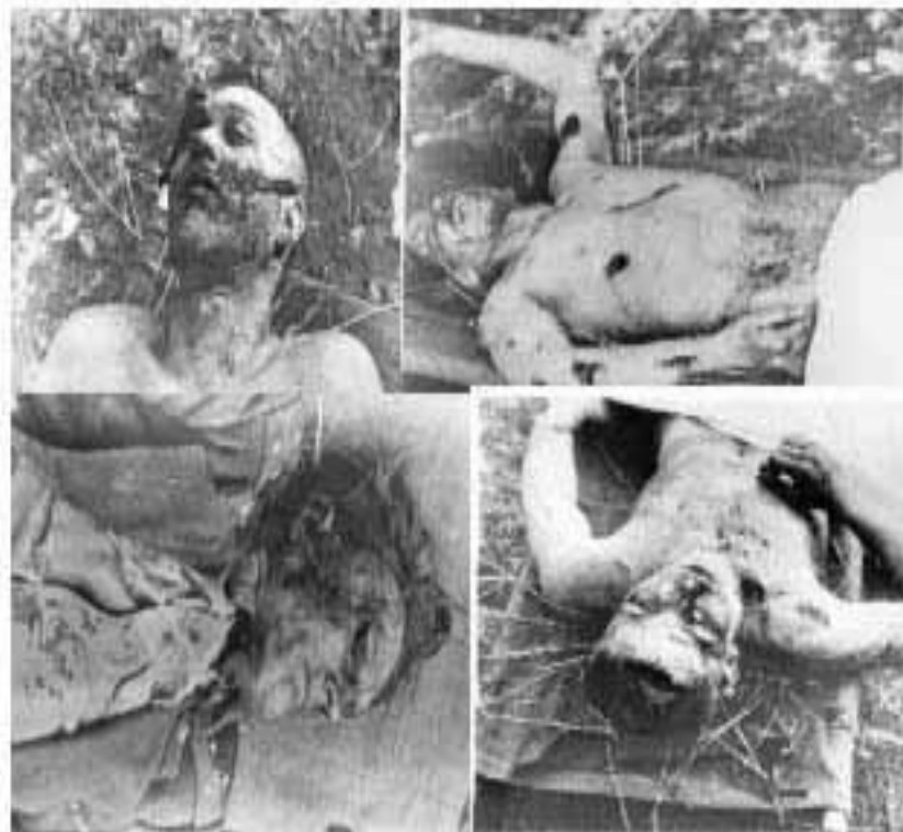
Тела погибших солдат