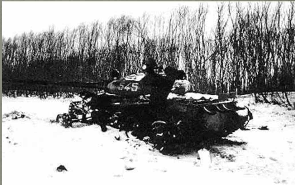
Танк Т- 62, на котором подбили полковника Леонова