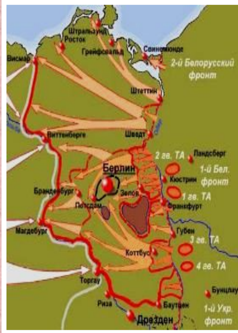
Битва за Берлин

24 апреля кольцо вокруг Берлина сомкнулось. Гитлер решил снять войска с Западного фронта. В результате этого американцы стремительно двинулись вперед и 25 апреля на Эльбе встретились с армией Конева. 30 апреля на Рейхстагом взвилось Красное Знамя. 2 мая Берлин пал. 8 мая в Карлхорсте в присутствии Жукова фельдмаршал Кейтель подписал капитуляцию. 9 мая капитулировала группировка в Праге. Этот день стал Днем Победы