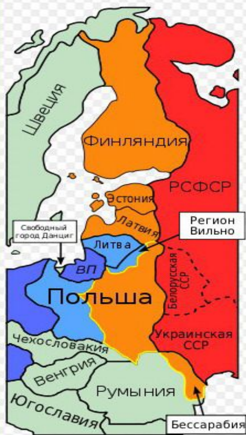
Действительные территориальные изменения в 1939 — 1940