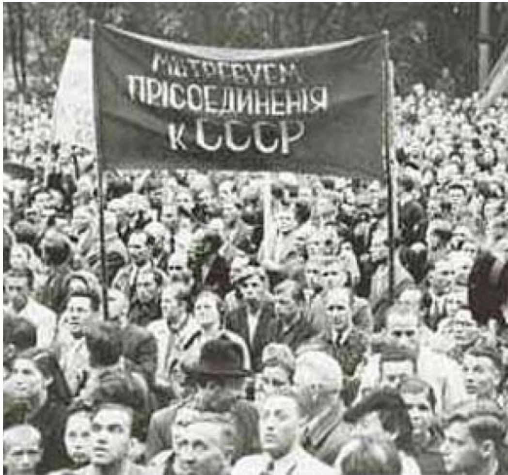
Митинги в Прибалтике с требованием присоединения к СССР.

Возникшие в Эстонии, Латвии и Литве «народные правительства» вскоре обратились к Советскому Союзу с просьбой о вхождении в состав СССР в качестве союзных республик.