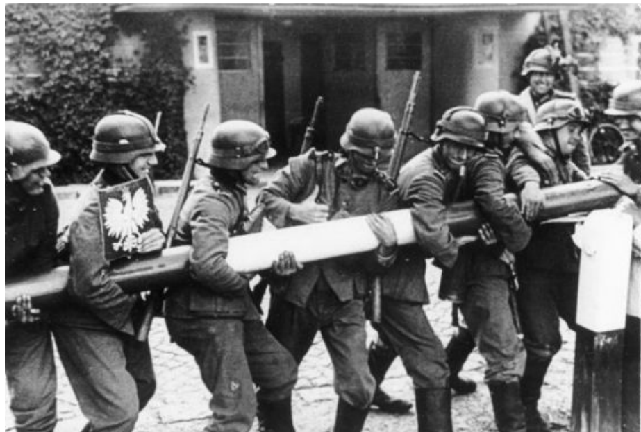
1. September 1939

Польские войска были быстро разбиты , правительство бежало из столицы.