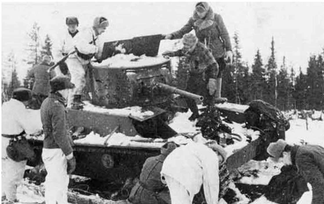
Подбитый советский танк Т-26

Бутылка с зажигательной смесью времён «Зимней войны»