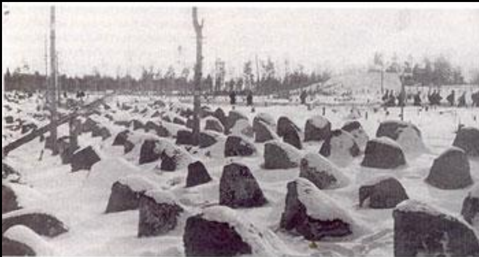
Противотанковые надолбы на линии Маннергейма

В итоге к началу осени было возведено несколько сот новых ДОТов, ДЗОТов, сотни километров траншей, окопов, бетонных надолбов.