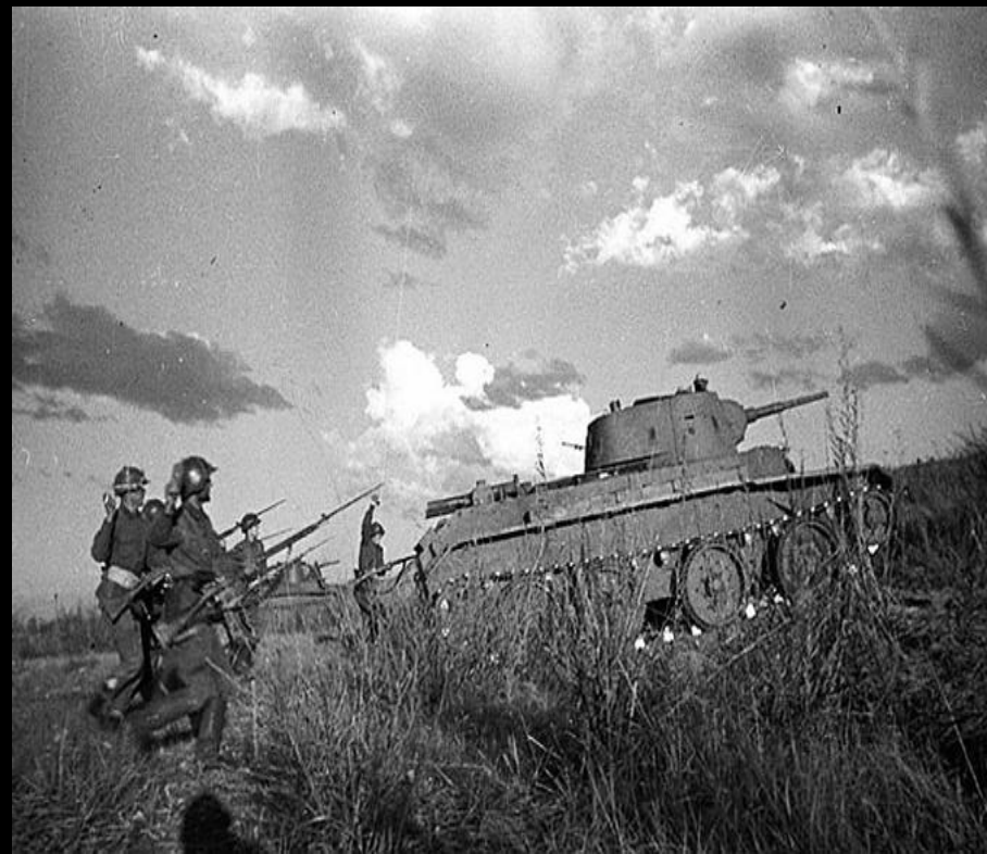
1938 г. – конфликт на оз. Хасан