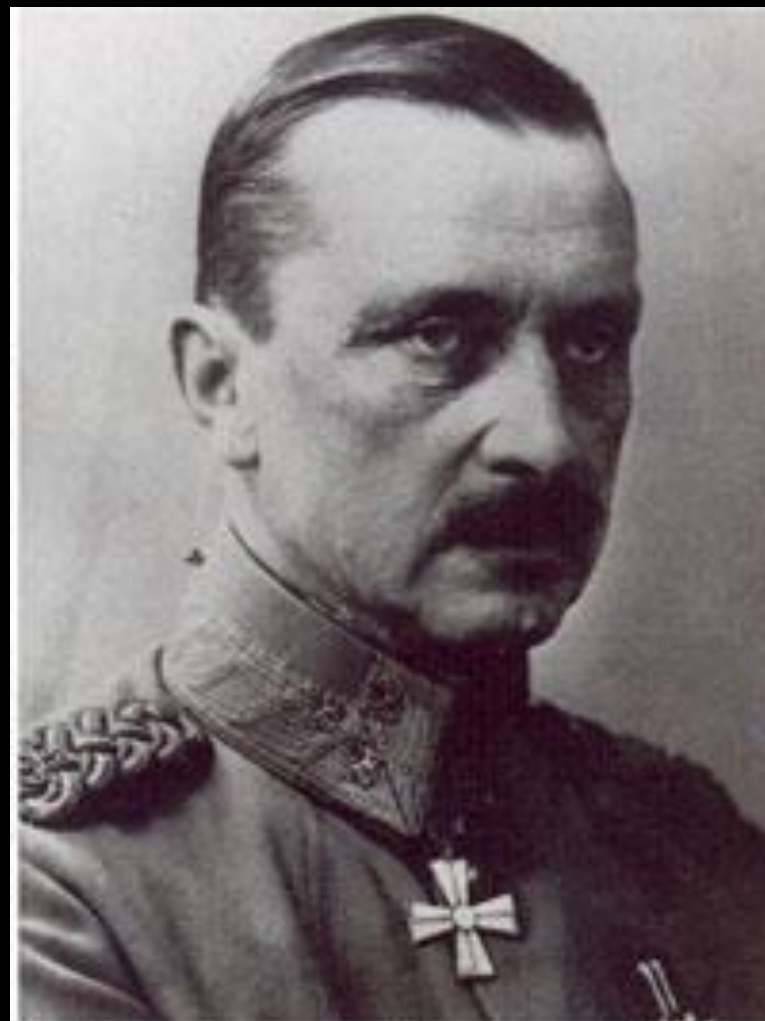
Карл Густав Маннергейм