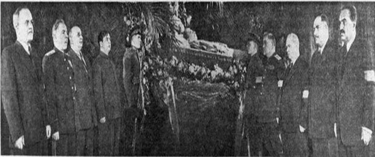
В Колонном зале Дома Союзов 9 марта 1953 года. На снимке слева направо: В. М. Молотов, К. Е. Ворошилов, Л. П. Берия, Г. М. Маленков, Н. А. Буганин, Н. С. Хрущев, Л. М. Каганович, А. И. Микоян у гроба вождя И. В. Сталина.

С глубокой болью прощается советский народ со своим вождем и учителем, отцом и другом — Носифом Виссарионовичем Сталиным. Коммунистическая партия, все трудящиеся еще теснее сплавивают свои ряды вокруг Сталинского Центрального Комитета и Советского Правительства, кланутся отдать все свои силы великому делу построения коммунизма.