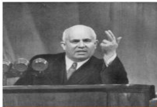
Первый секретарь ЦК КПСС

Один из виновников «Ленинградского дела»