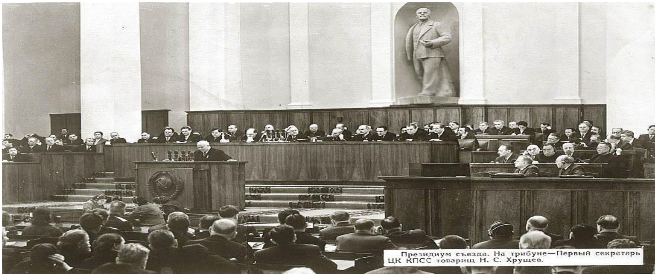
Президиум съезда. На трибуне—Первый секретарь ЦК КПСС товарищ Н. С. Хрущев.