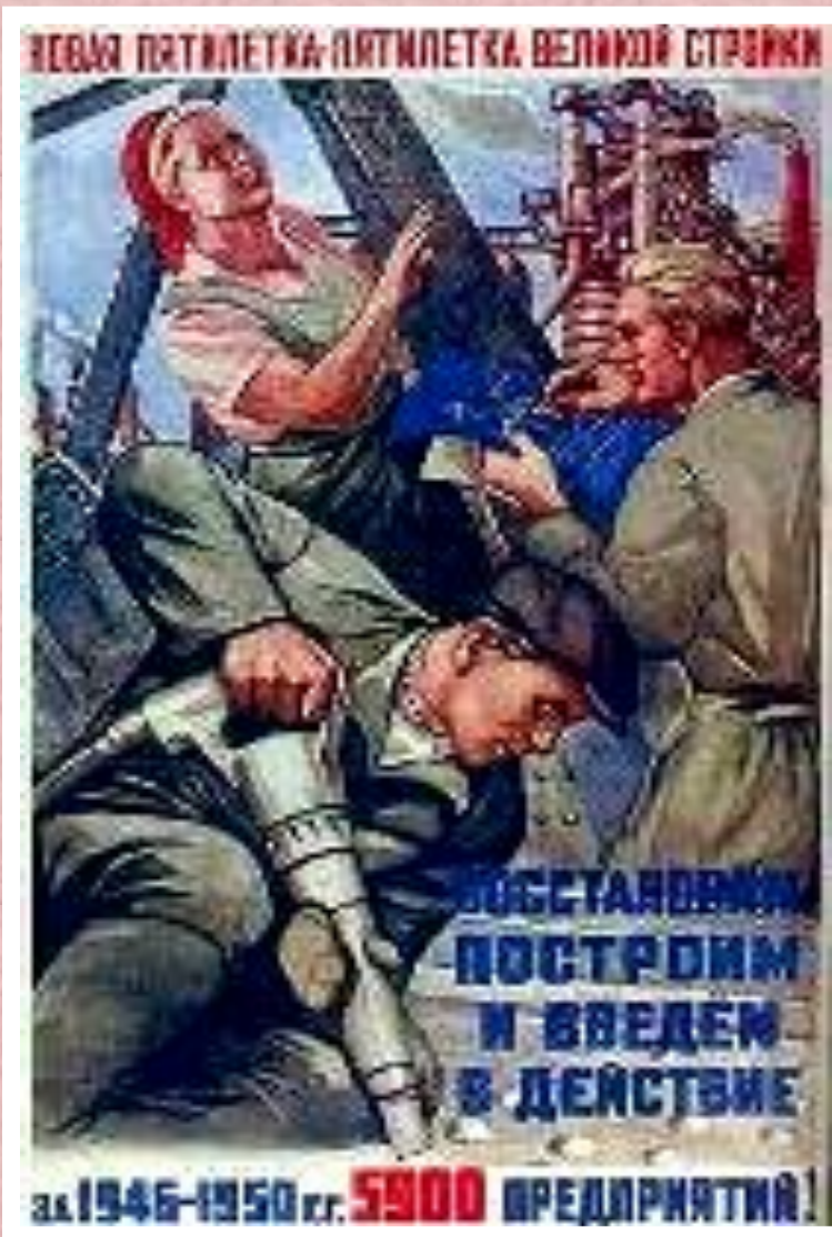
Плакат 1946 г.

Тем не менее главным источником восстановления оставалось село-закупочные цены в 10-12 раз были ниже розничных. На восстановлении работали пленные и узники ГУЛАГа. Огромную роль продолжало играть соцсоревнование. Токарь Г.Борткевич в 1948 г. выполнил 13 сменных норм за день. К 1949 г. экономика была восстановлена плановое задание было перевыполнено в промышленности на 70% в сельском хозяйстве - на 48%.