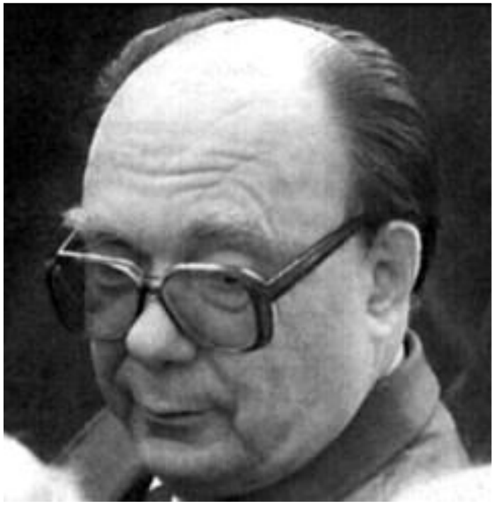
Секретарь ЦК КПСС по идеологии А.Н.Яковлев.

Гласность привела к переосмыслению прошлого. В печати были подняты «закрытые» прежде темы, критике подверглись ближайшие соратники Ленина.