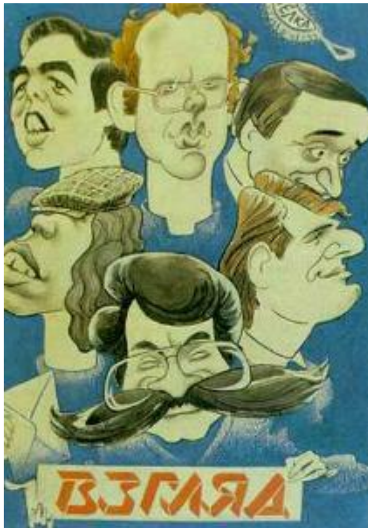
Шарж на ведущих Программы «Взгляд».

Ответ на эту статью последовал лишь через месяц, когда М.Горбачев вернулся из-за границы. После этого в СМИ критика тоталитарной системы развернулась с новой силой.