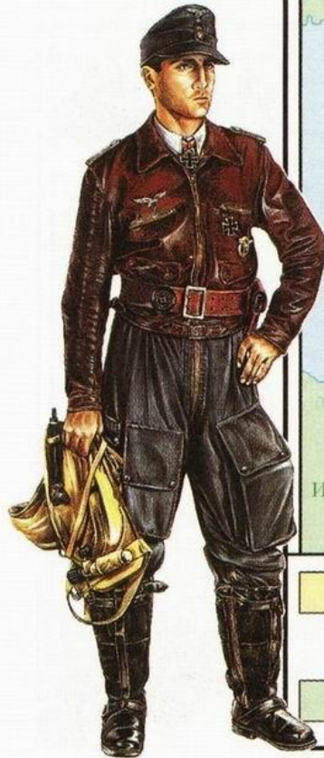
Немецкий военный лётчик времён Второй мировой войны.