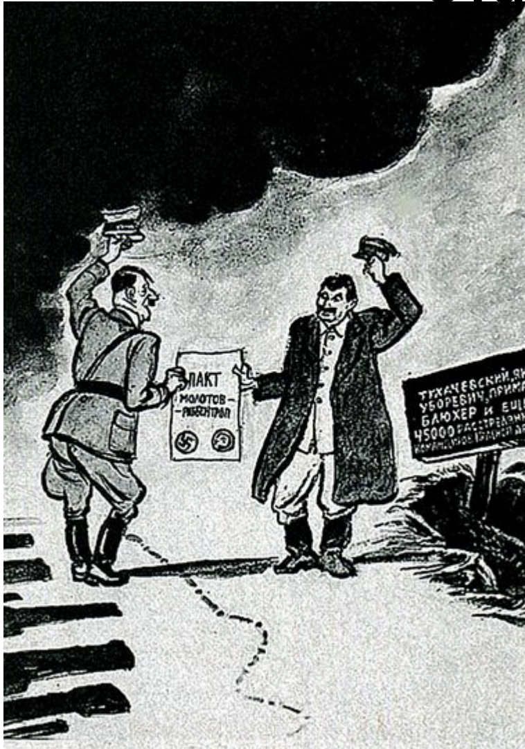
Карикатура. Б. Ефимов. 1989 г.