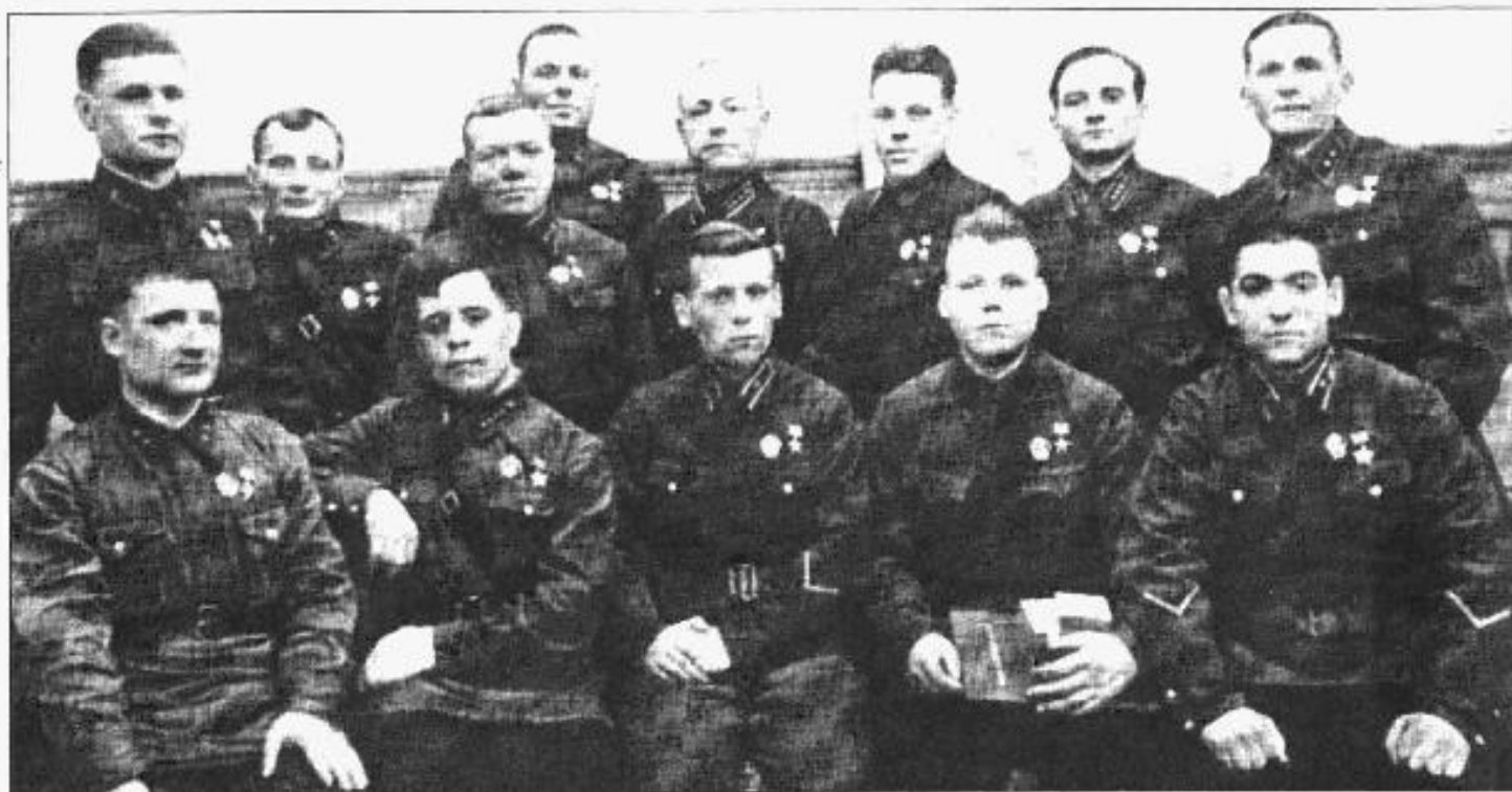
Группа Героев Советского Союза после вручения наград