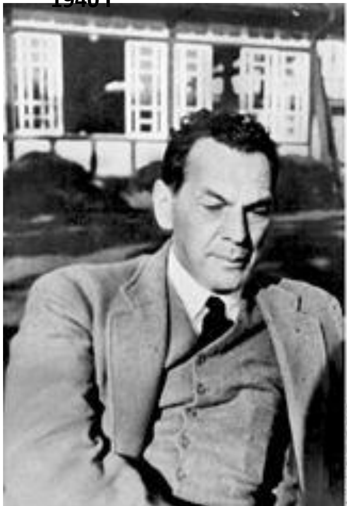
Рихард Зорге в 1940 г