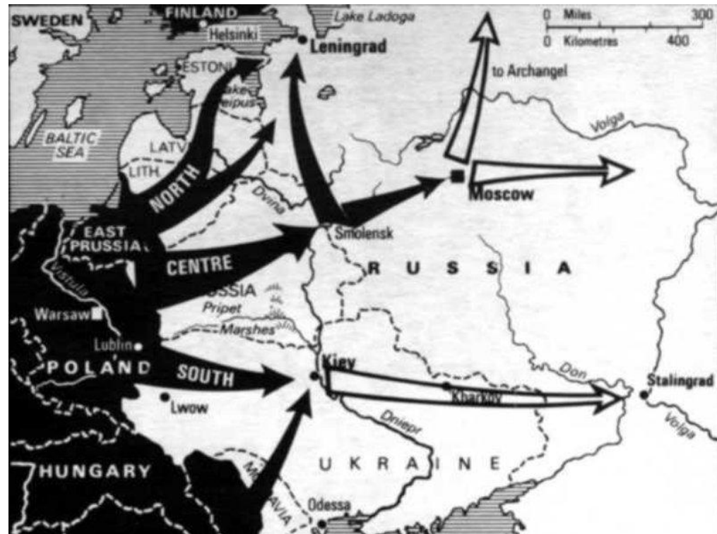
Карта: операция «Барбаросса»