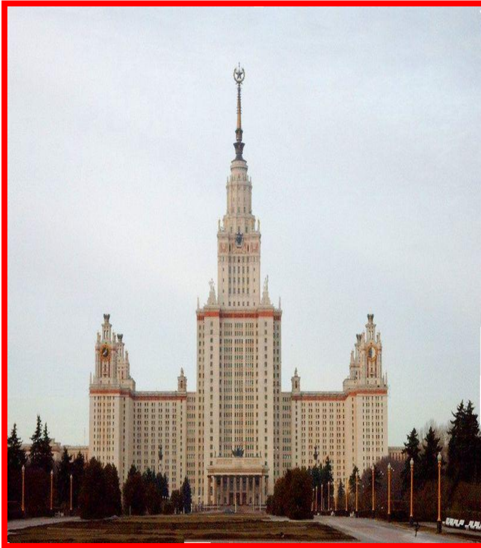
Главное здание МГУ 1953 г. 36 этажей