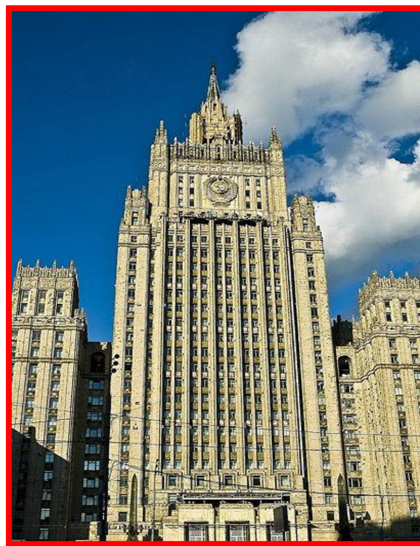
МИД России 1953 г. 27 этажей