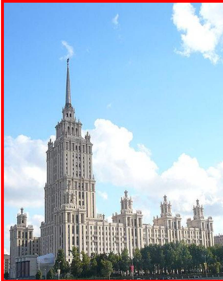
Гостиница «Украина» 1957 г. 29 этажей