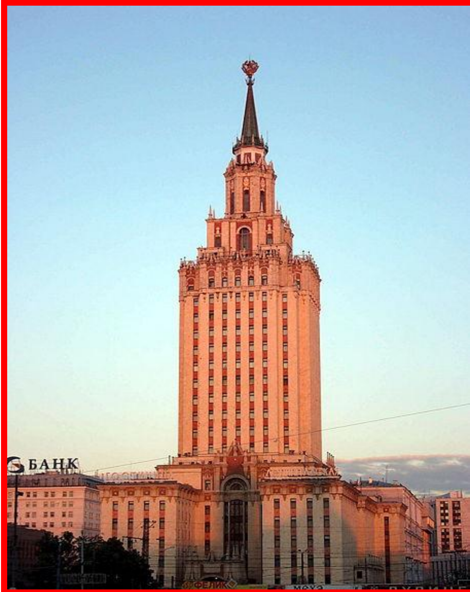
Гостиница Ленинградская 1952 г. 17 этажей