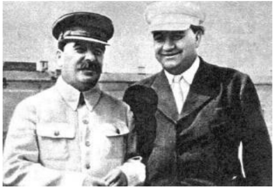
И.Сталин и Г.Димитров

С 1947 г. под давлением СССР ускорился процесс формирования коммунистических правительств в странах «народной демократии». В это же время установился коммунистический режим в С.Корее, а в 1949 г. в Китае. СССР оказывал им огромную материальную помощь, «привязывая» к себе. В 1949 г. был создан СЭВ, а в 1955 г. Организация Варшавского Договора. Кроме того коммунисты оказались у власти во Франции и в Италии.