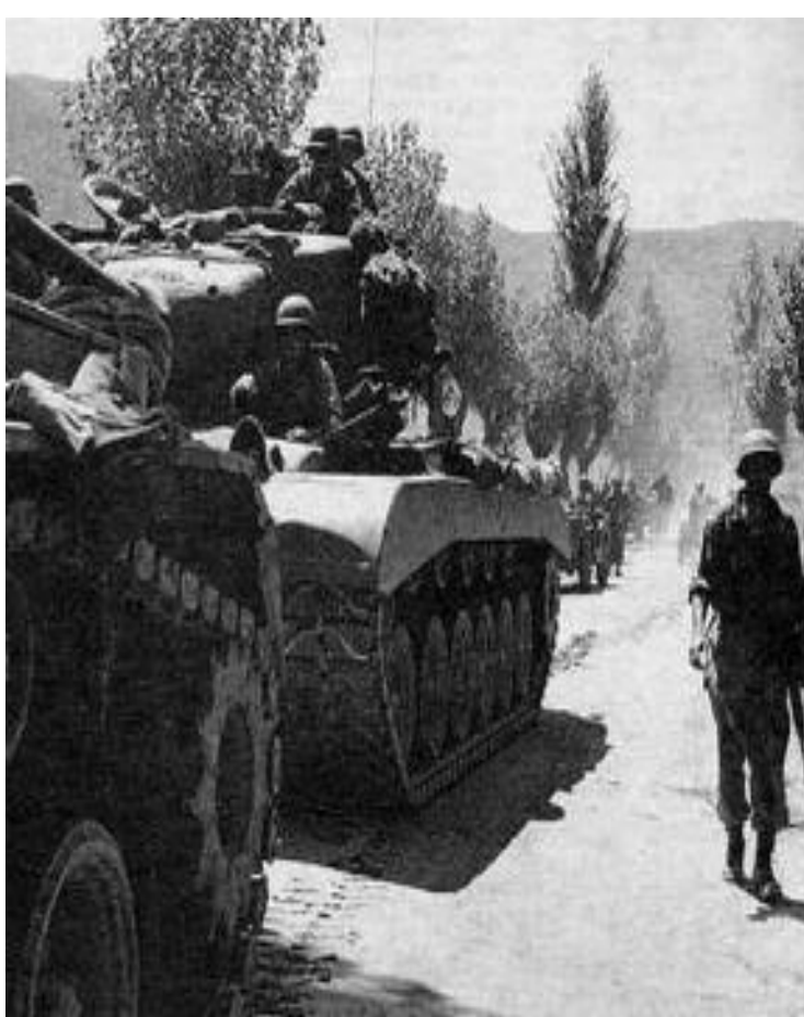
Американские войска в Южной Корее.

Высадившись в Чемульпо союзники стремительно освободили захваченные территории и вторглись в С.Корею. КНДР обратилась за помощью к Китаю и Советскому Союзу. Получив советскую технику и помощь Китайской армии, северяне выровняли линию фронта и в 1954 г. был подписан мирный договор. Корейская война показала, как «холодная» война легко может перерости в «горячую».