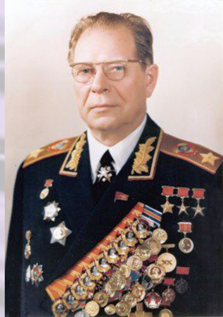
МИНИСТРОМ ОБОРОНЫ Д.Ф.УСТИНОВ