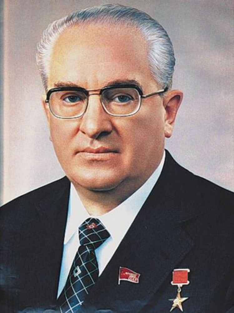
ОКТАБРЬ 1964 г – ПРЕДСЕДАТЕЛЕМ КГБ СТАЛ Ю.В.АНДРОПОВ