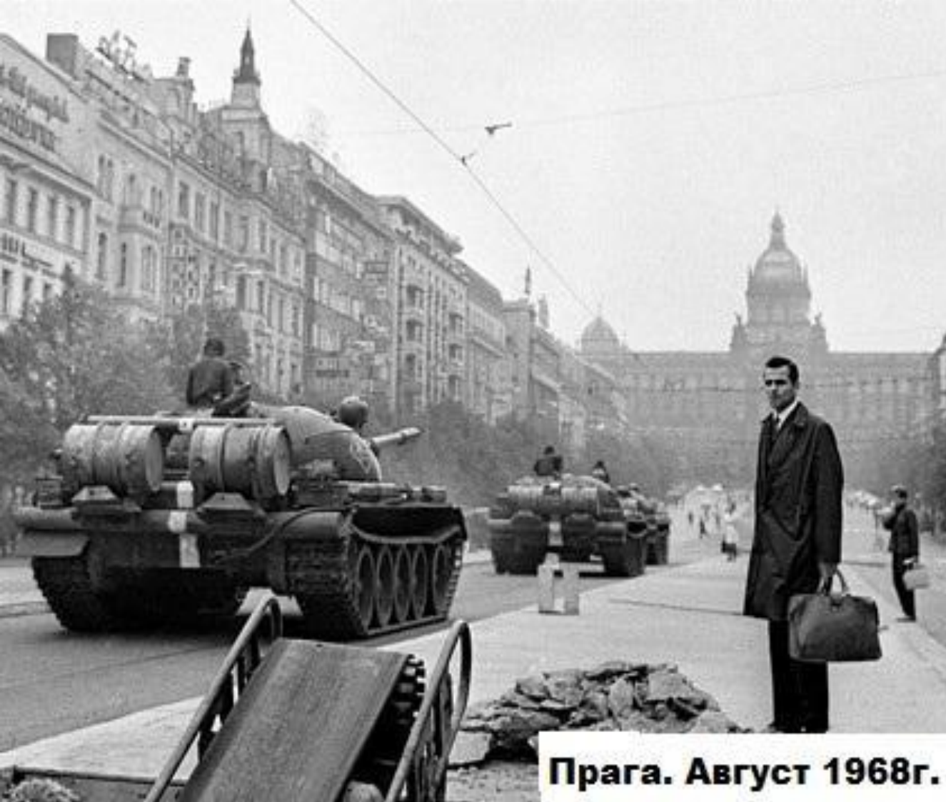
Прага. Август 1968г.

У стосунках із соціалістичними країнами домінувала «доктрина Брежнєва» — визнання суверенності союзників з одночасним «правом» СРСР на інтервенцію