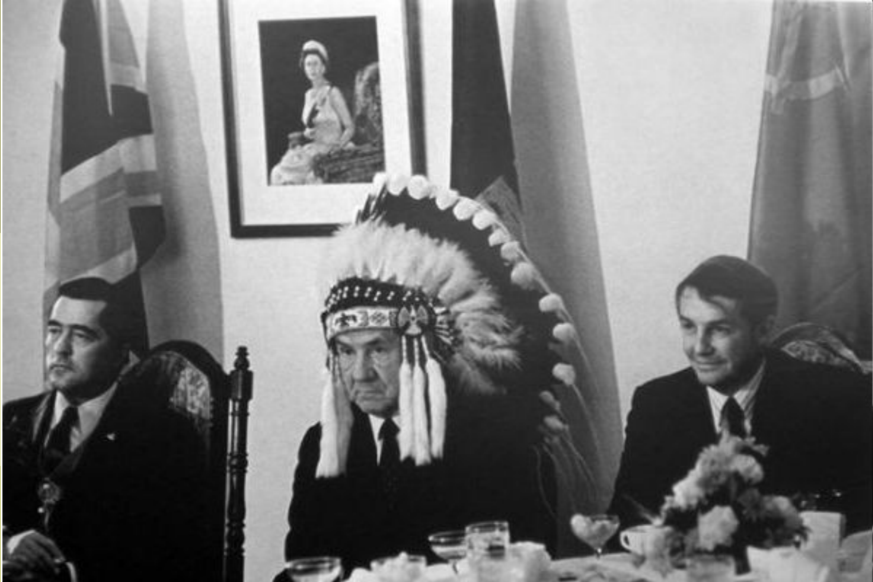
Председатель Совета министров СССР А. Н. Косыгин на обеде, который дал в его честь премьер-министр канадской провинции Альберта Э. Логхид. 25.10.1971 г.