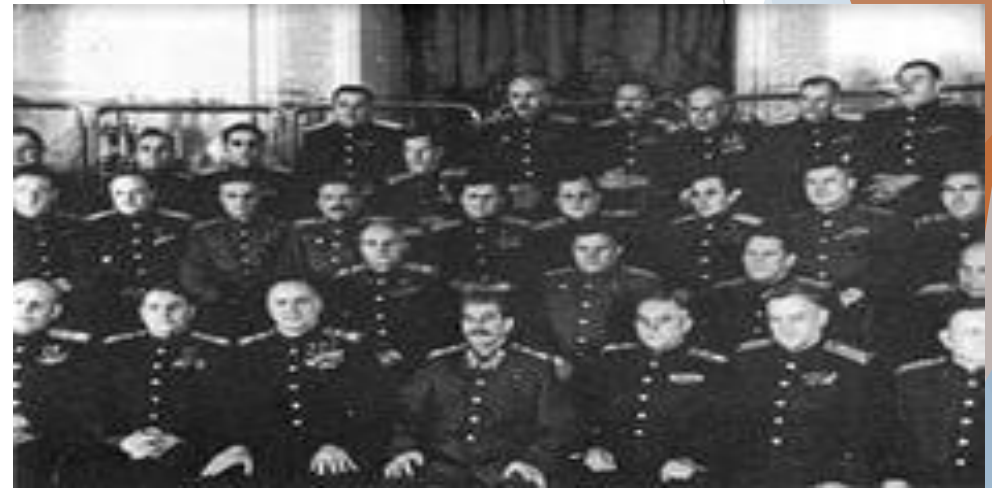
Фото с маршалом Г.К.Жуковым . И.В.Сталин ушел, его вмонтировали в центр фото позже.