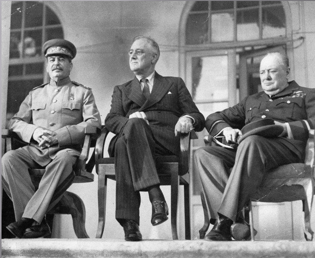
Слева на право: И.В.Сталин, Ф. Д.Рузвельт, У.Черчилль