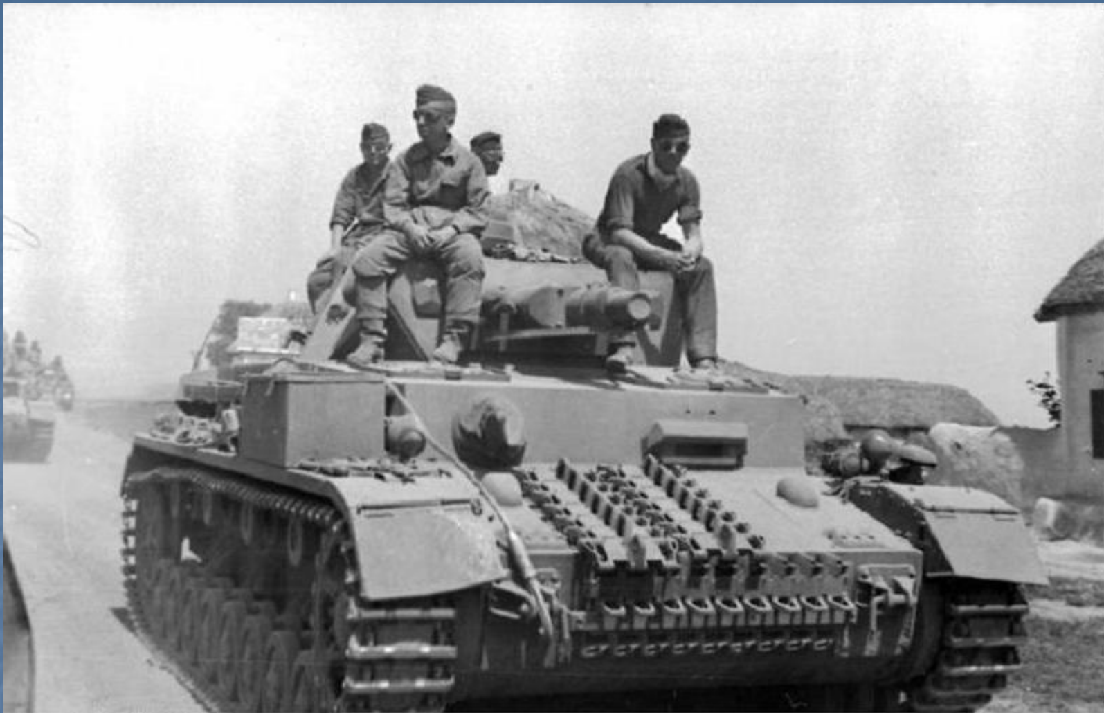
Наступление немецких войск.