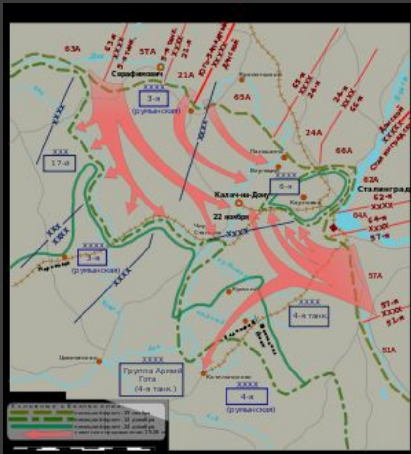
Боевые действия с 19 ноября по 24 декабря 1942 года