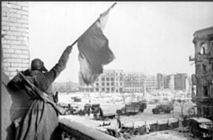
Флаг над освобождённым городом, Сталинград, 1943 год