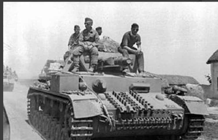
Наступление немецких войск.

Боевые действия с 7 мая по 23 июля 1942 года.