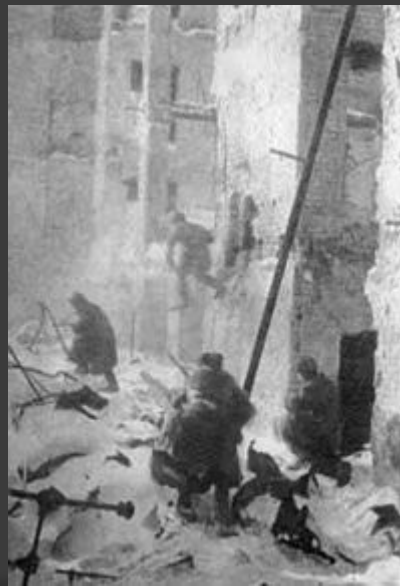
Уличные бои в Сталинграде