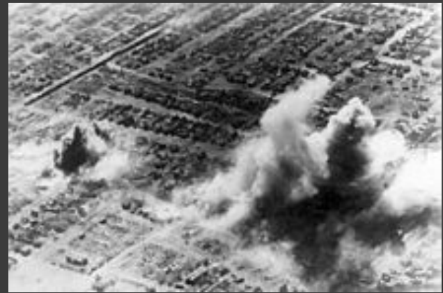
Люфтваффе проводит бомбардировку жилых районов Сталинграда, октябрь 1942 года