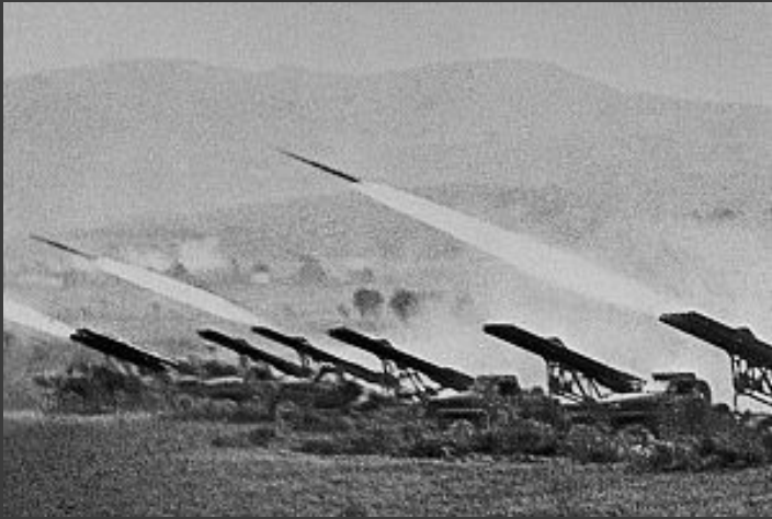
Артподготовка советского наступления