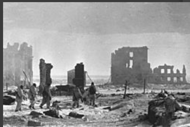
Центр города Сталинграда, 2 февраля 1943 года