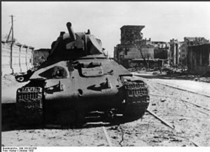
Подбитый советский танк Т-34 в Сталинграде, 8 октября 1942 года