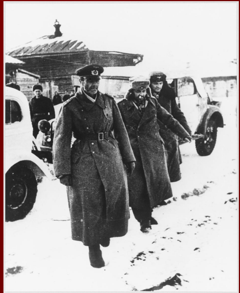
Пленение генерал- фельдмаршала Паулюса в Сталинграде, 1943 год