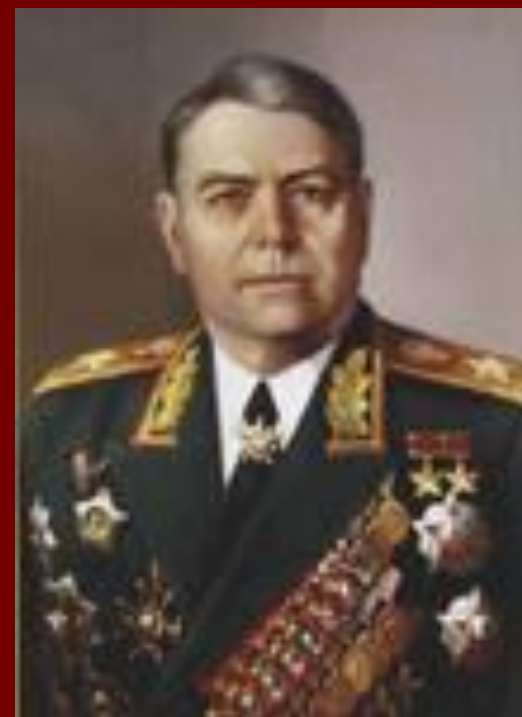
Александр Михайлович Василевский