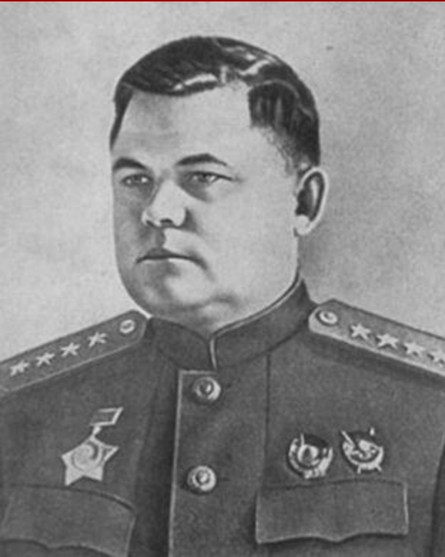
Юго-Западный фронт. Командующий — генерал Николай Федорович Ватутин