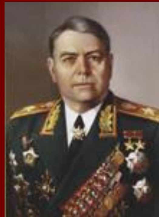
Александр Михайлович Василевский