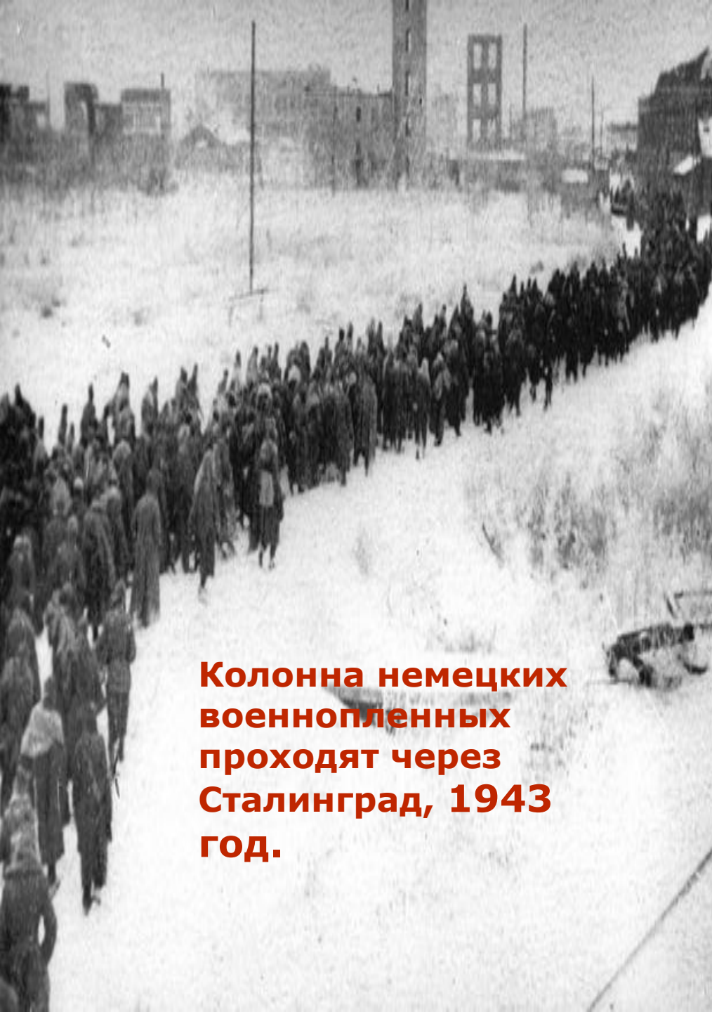
Колонна немецких военнопленных проходят через Сталинград, 1943 год.