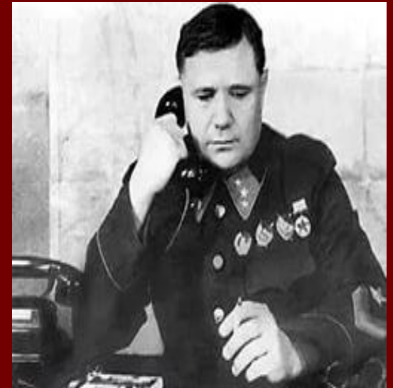
Сталинградский фронт. Командующий — генерал Андрей Иванович Еременко