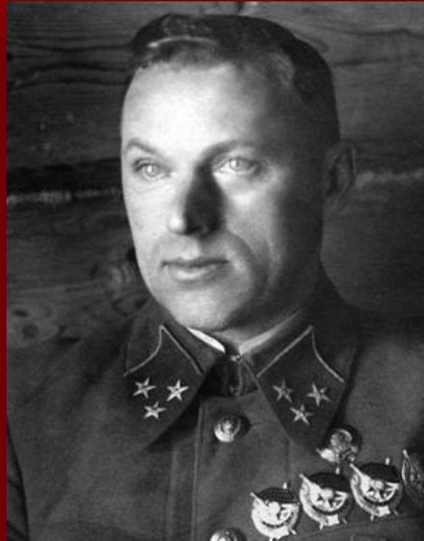
Донской фронт. Командующий — генерал Константин Константинович. Рокоссов ский