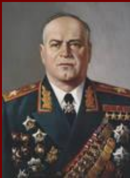
Георгий Константинович, Жуков