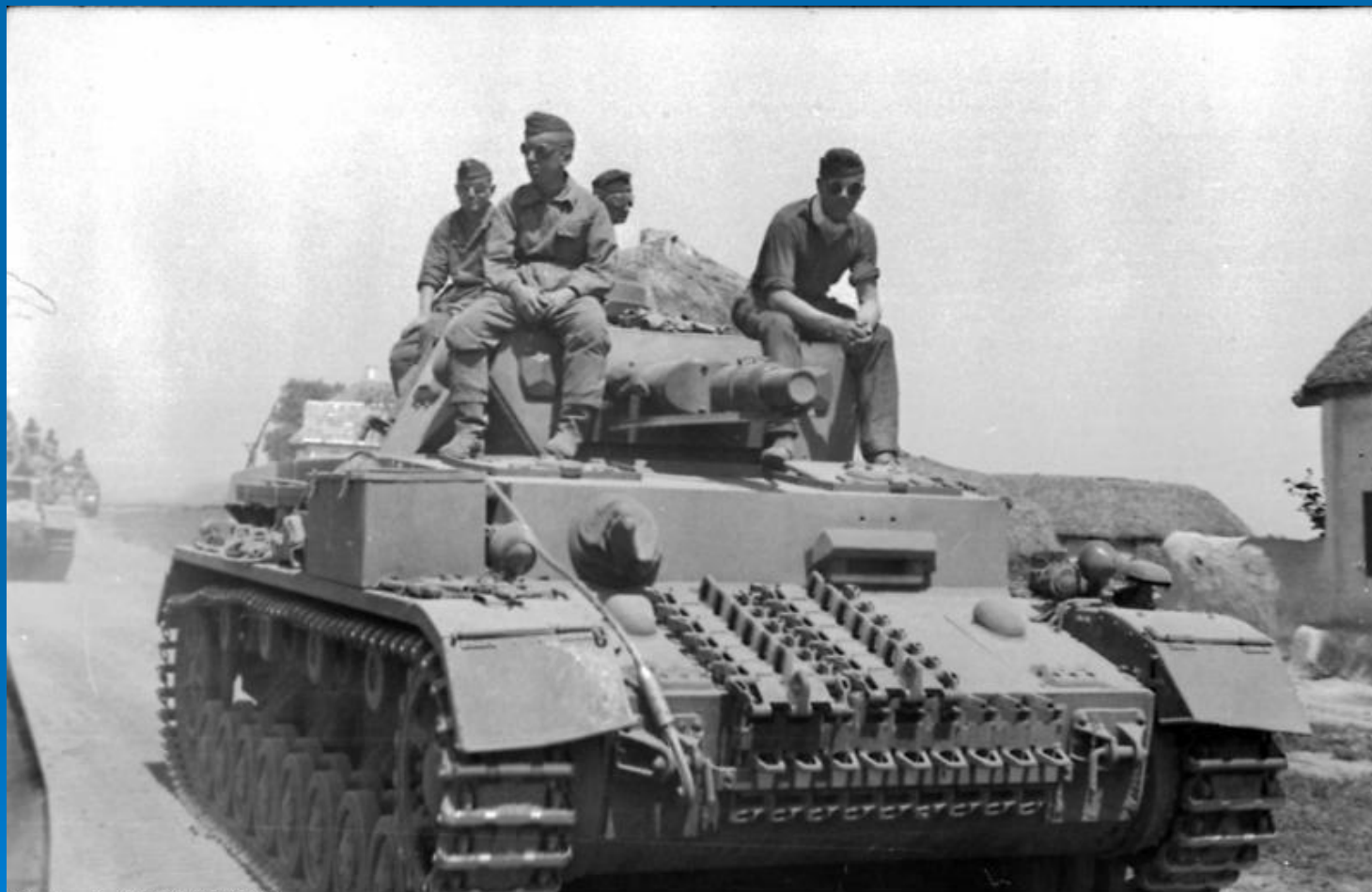
Juni 1942