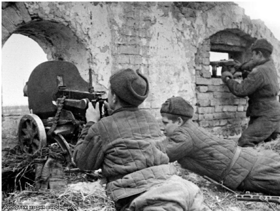
Репортаж из дня вчерашнего

По своим масштабам и ожесточенности она превзошла все прошлые битвы : на территории почти в сто тысяч квадратных километров, сражались более двух миллионов человек.