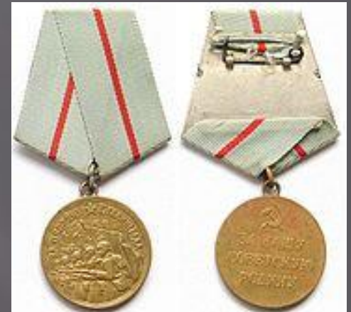
Медаль «За оборону Сталинграда».