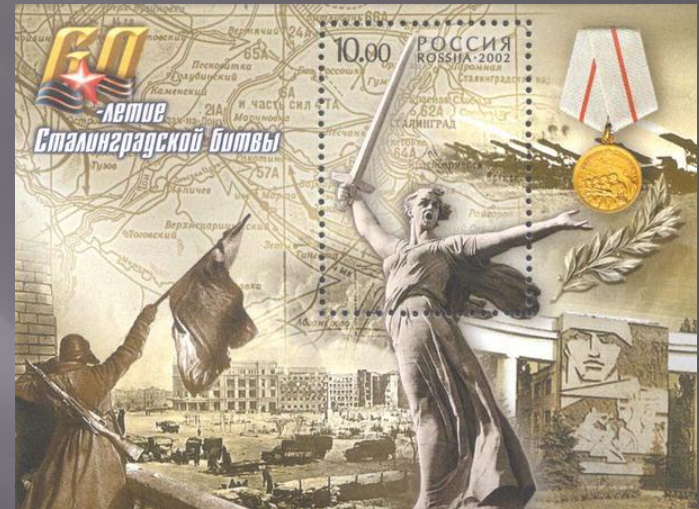
Почтовый блок России «60-летие Сталинградской битвы» 2002 года.