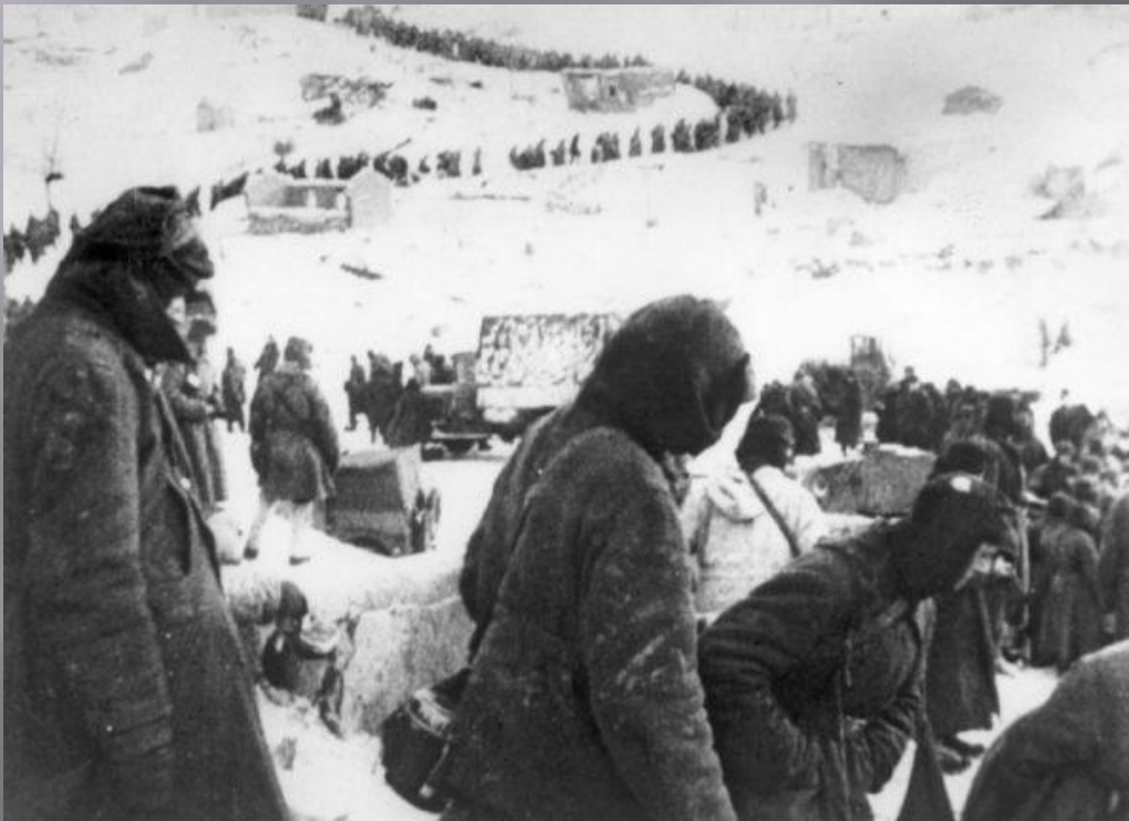
Колонна пленных немцев