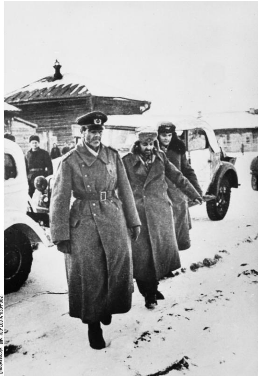
Война. 1943. 181. Вилейский фронт. 13.1.43.

Тем не менее, несмотря на серьезный пропагандистский успех Сталинградской операции, и несколько более скромный в военном отношении.