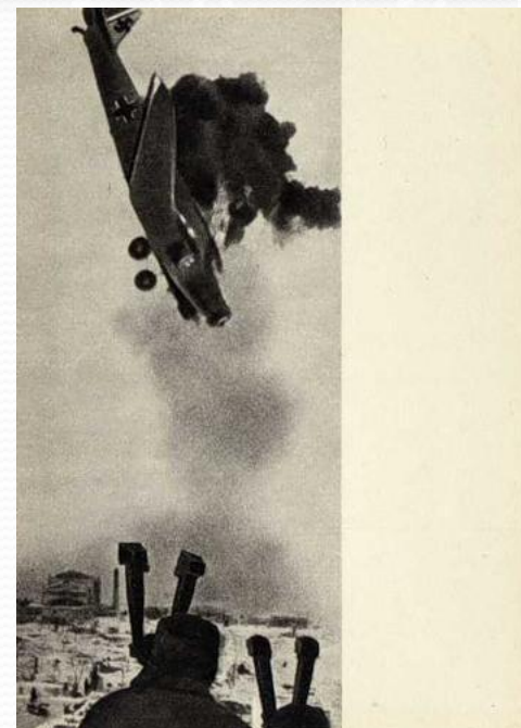
Сбит фашистский транспортный самолет "Ю-52" на подступах к Сталинграду, январь 1943 год.