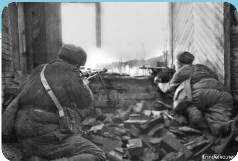
Бой у Дома Павлова. Сталинград, 1942