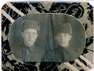
г. Владивосток 2 я речка №А-539-1