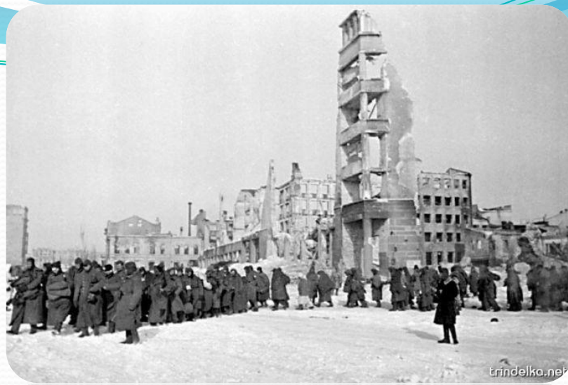
Пленные немцы проходят по улицам Сталинграда.