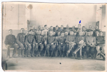
Германия Бюро пошт- сешикара 20.04.1945г.