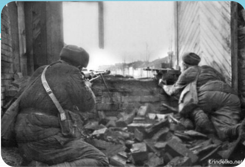
Бой у Дома Павлова. Сталинград, 1942