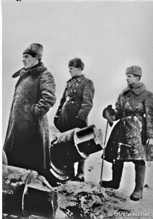
Командующий 62-й армией генерал-лейтенант В.И. Чуйков