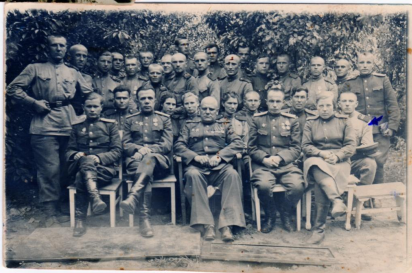
г. Штэттин (Германия) группа верхантекого и офицерского состава с командиром соединения. 20.05.45г.