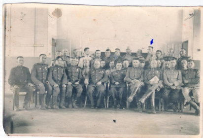
Германия Боссе пошт- сешикара 20.04.1945г.