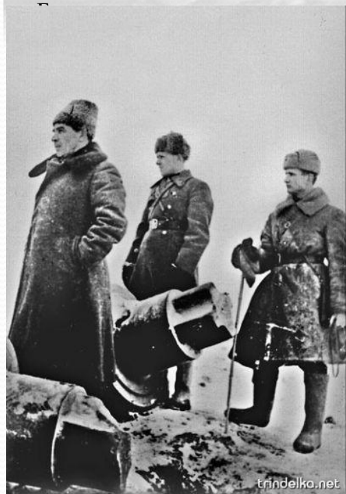
Командующий 62-й армией генерал-лейтенант В.И. Чуйков