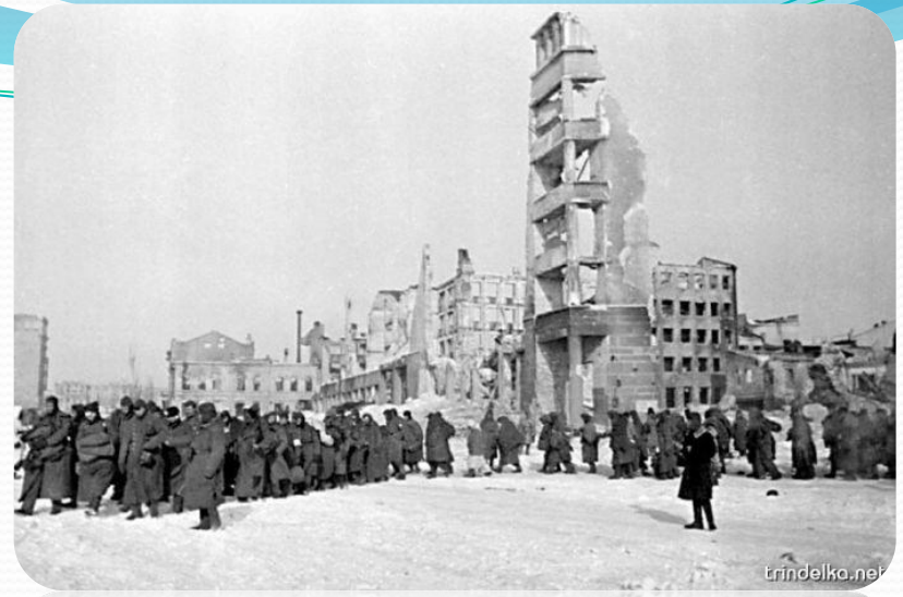
Пленные немцы проходят по улицам Сталинграда.